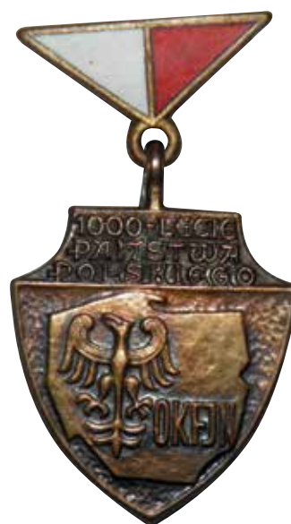
8. Odznaka „1000-lecie Państwa Polskiego” Ogólnopolskiego Komitetu Frontu Jedności Narodowej, 1966 r.

okolicznościowy, brązowy medal autorstwa Waław Kowalika, wybity w nakładzie 700 egzemplarzy i pełniący rolę ekskluzywnej pamiątki w ozdobnym pudełku (il. 7). Na awersie, w polu ujętym legendą otokową „TYSIĄCLECIE PAŃSTWA POLSKIEGO 966–1944–1966” ukazano klęczącego włościana, trzymającego w dłoniach rosnące drzewko dębowe, a obok niego wyobrażono księcia Mieszka z diademem na głowie, z mieczem i tarczą zdobioną Orłem Białym. Na rewersie z otokowym napisem „POLSKA RZECZPOSPOLITA LUDOWA SPADKOBIERCZYNIĄ TRADYCJI TYSIĄCLECIA” przedstawiono bloki skalne tworzące zarys czterodzielnego pomnika – na dolnym bloku ukazano skrót PKWN, na drugim półpostacie żołnierzy oraz nazwy miejsc bitew polskiego wojska w II wojnie światowej (wyłącznie z frontu wschodniego), na trzecim półpostacie robotników przy nazwach polskich miast