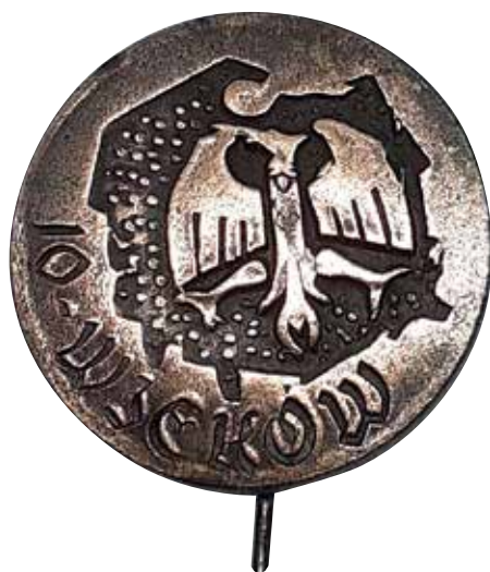
9. Odznaka turystyczna „10 - WIEKÓW” Ogólnopolskiego Konkursu Krajoznawczo-Turystycznego „Przez X wieków Polski”, 1966 r., własność prywatna.

przemysłowych, a na czwartym kobietę i mężczyznę oraz herby 17 województw. Także i w tym przypadku ikonografia i treść medalu są oczywiste: przy pominięciu aktu chrztu Mieszka akcent widnieje na „założeniu” w 966 r. państwa polskiego, które odrodzone w 1944 r. już w nowej, socjalistycznej formacji społeczno-politycznej, pozwoliło swoim obywatelom świętować jubileusz jego Tysiąclecia w 1966 r. 15 Do tej grupy zaliczyć można jeszcze ograniczone chronologicznie do roku 1966–1967 Odznaki Tysiąclecia, licznie przyznawane przez Ogólnopolski Komitet Frontu Jedności Narodu osobom oraz stowarzyszeniom politycznym i społecznym, zaangażowanym właśnie organizację obchodów 1966 r. (il. 8). Odznaka zwraca uwagę dość ciekawym motywem ikonograficznym, zauważalnym zresztą w innych wyrobach tego rodzaju 16 . Pod napisem „1000-lecie Państwa Polskiego” widnieje mapa Polski o całkowicie ahisterycznym charakterze, bowiem nie