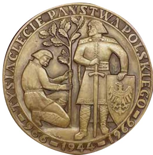
7. Medal „Tysiąclecie Państwa Polskiego 966–1944–1966”, proj. Waław Kowalik, 1966 r., własność prywatna.

W tej grupie oficjalnych pamiątek Tysiąclecia wspomnieć należy jeszcze trzy dzieła, choć należące do kategorii numizmatów i falerystyki. Pierwszym jest zaprojektowana przez Józefa Gosławskiego obiegowo-okolicznościowa moneta srebrna (próba 0,900; waga 20,0 g) o wartości nominalnej 100 zł, wybita w nakładzie 190 000 egzemplarzy i wprowadzona do obiegu właśnie 22 lipca 1966 r. 14 Przedstawia ona na rewersie postacie Mieszka i Dąbrówki w stylizowanych ubiorach, ujęte napisem otokowym „TYSIĄCLECIE PAŃSTWA POLSKIEGO”, a na awersie Orła Białego ujętego napisem „POLSKA RZECZPOSPOLITA LUDOWA 1966” i herbami 17 województw. Mieszko i Dąbrówka ukazani zostali jako założyciele dynastii i państwa, choć oczywiście pominięto elementy symboliczne, które mogłyby być interpretowane jako odnoszące się do aktu chrztu księcia. Czytelnym nawiązaniem do współczesności są legendy otokowe rewersu i awersu, a także herby województw tworzących podział administracyjny kraju, obowiązujący w 1966 r. Podobny charakter ma