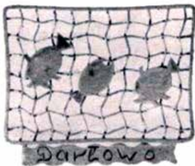
15. Znaczek pamiątkowy z Darłowa, proj. Zdzisław Łęcki, 1953 r.

przybierało to formy pewnej indoktrynacji ideologicznej, zwłaszcza gdy szczególnie eksponowano dzieje lokalnego tzw. ruchu rewolucyjnego 19 . Konkurs był największą imprezą turystyczną w PRL do 1966 r., opartą o aktywność setek lokalnych kół PTTK, które organizowały we własnym zakresie rajdy, zloty i wycieczki 20 . Właśnie te lokalne wydarzenia upamiętniano oprócz wspomnianego znaczka konkursowego kolejnymi drobnymi odznakami z mosiądzu lub miedzi i często z emaliowaną dekoracją, produkowanymi w miejscowych zakładach