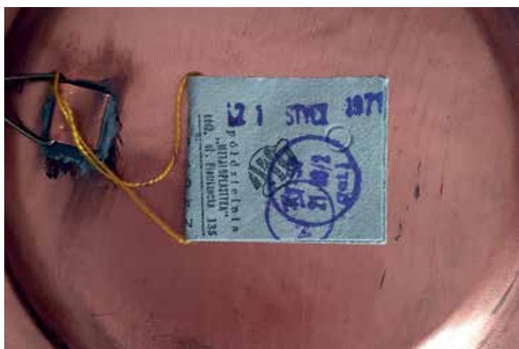
6. Metka handlowa talerza miedzianego z Orłem Białym, spółdzielnia Metaloplastyka, Łódź, 1971 r. (wzór z 1966 r.), własność prywatna.

nawiązujących do uroczystości 1966 r.? Odpowiedź na tak postawione pytanie wydaje się jednoznaczna – obchody nie wywarły szczególnie istotnego wpływu na ilościową ofertę wytwórców biżuterii tak w zakresie jej form, jak i ikonografii. Jak udowodniła wspomniana wystawa w Państwowym Muzeum Archeologicznym w Warszawie, eksponowane tam w 1964 r. dzieła Zaremskich, odpowiadające pewnej przyjętej idei łączności sztuki nowoczesnej z odkryciami archeologicznymi, powstały tak naprawdę już kilka lat przed wystawą i z artefaktami archeologicznymi