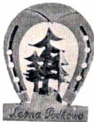
14. Znaczek pamiątkowy z Leśnej Podkowy, proj. Franciszka Szymanek, 1953 r. Fot. wg M. Synkowski, dz. cyt., s. 41