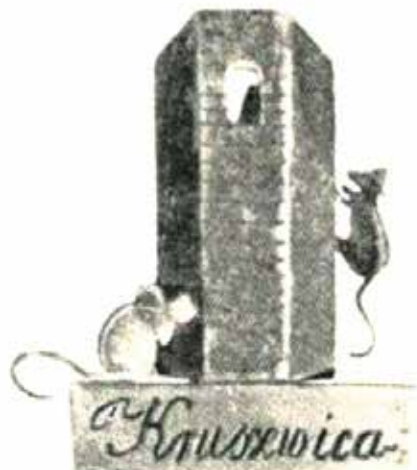
13. Znaczek pamiątkowy z Kruszwicy, proj. Helena Krygier, 1953 r. Fot. wg M. Synkowski, „ORNO” – rzemieślnicza spółdzielnia metaloplastyczna, „Przemysł Ludowy i Artystyczny”, nr 1, 1956, s. 41