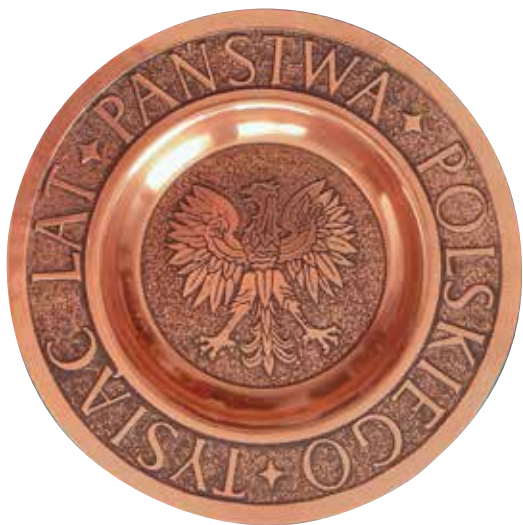
5. Talerz miedziany z Orłem Białym, spółdzielnia Metaloplastyka w Łodzi, 1971 r. (wzór z 1966 r.), własność prywatna.