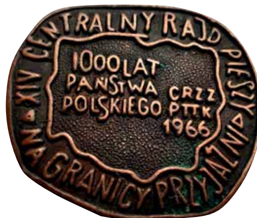
12. Odznaka turystyczna XIV Centralnego Rajdu Pieszego CRZZ PTTK „Na Granicy Przyjaźni”, 1966 r. Fot. za https://ktpzg.pttk.pl/muzeum/raid_1966.php

było z pewnością zamierzone, ponieważ wskazywało jednoznacznie, że Polska Rzeczpospolita Ludowa naturalnie kontynuuje 1000-letnią historię państwa.