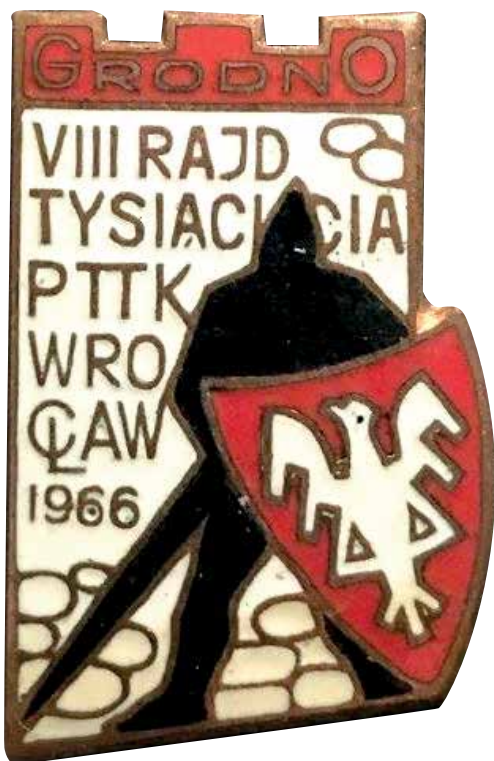
11. Odznaka turystyczna VIII Rajdu Tysiąclecia PTTK Wrocław, 1966 r., własność prywatna.