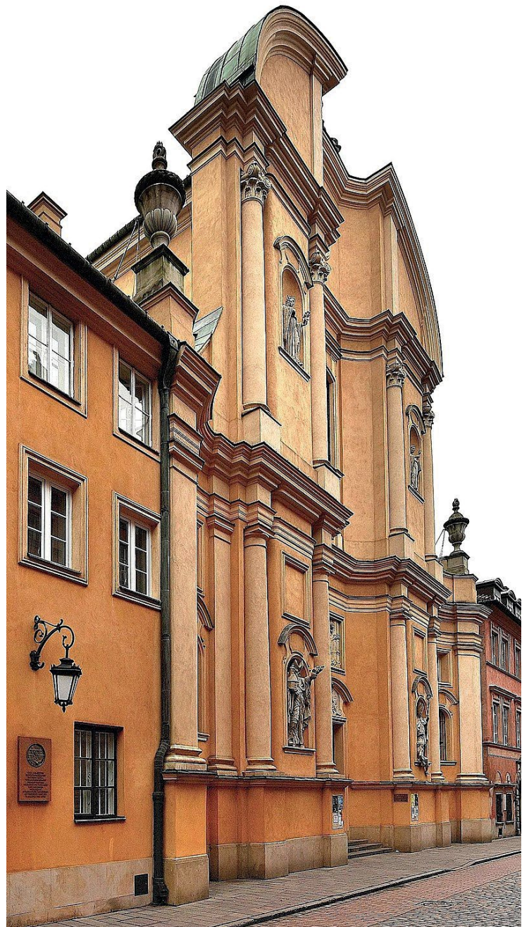
4. Fasada kościoła Augustianów-Eremitów pw. św. Marcina w Warszawie.

Wspomniany brak profilowanych obramień lub jedynie płaskie opaski obiegające okna występują w Wilnie najwcześniej w dzwonnicy kościoła Karmelitów Trze-wiczkowych pw. Wszystkich Świętych, powstałej przed 1743 r. Po pożarze miasta w 1748 r. motyw ten pojawia się wielokrotnie. Występuje m.in. w wieżach jezuickiego kościoła pw. św. Rafała (1751–1752), w kopułowej kruchcie świątyni Misjonarzy (1755), w tamburze i lukarnach kopuły jezuickiego kościoła pw. św. Kazimierza, w nadbudowanych partiach fasady kościoła