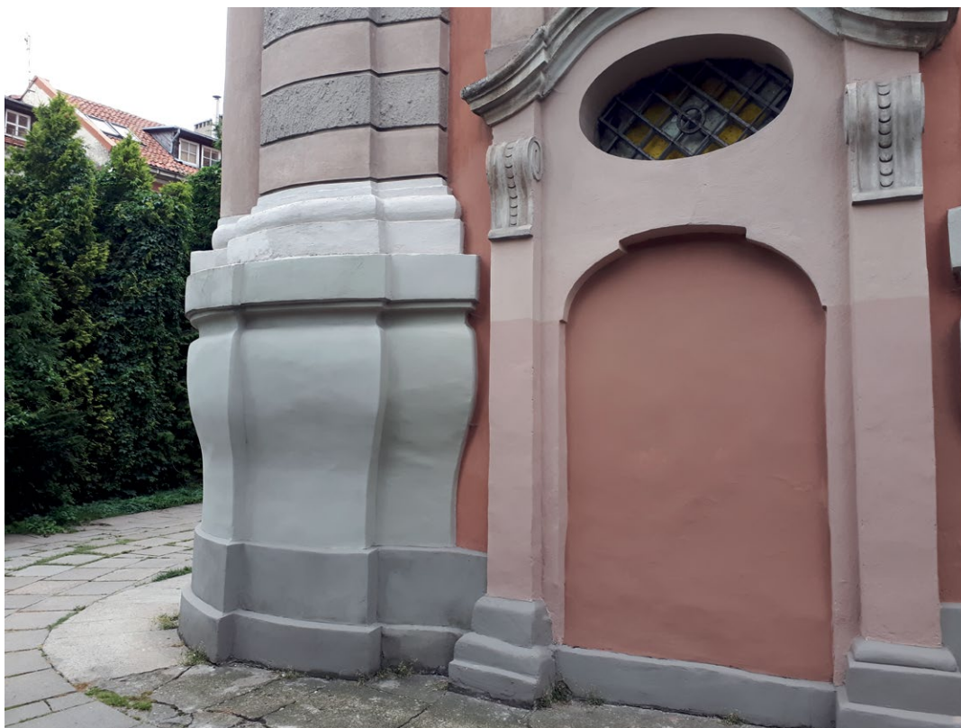
5. Fragm. przyziemia dzwonnicy kościoła Karmelitów Trzcizkowskich w Wilnie. Fot. Z. Rejewska, 2019 r.

karmelickiego w Głębokiem (1753–1756), w wieżyczkach dominikańskiego kościoła w Posiniu (1761–1770), w świątyniach Bazylianów w Berezeczcu (1751–1767) i Połocku (1748–1762), a także w wykazującej cechy wspólne z barokiem wileńskim podwarszawskiej Kobyłce (1736–1740) 61 . Jest to więc motyw obiegowy. Jedynie bardziej rozbudowane obramienie okienne w wileńskim kościele Augustianów-Eremitów pojawia się w pierwszej kondygnacji wieży.