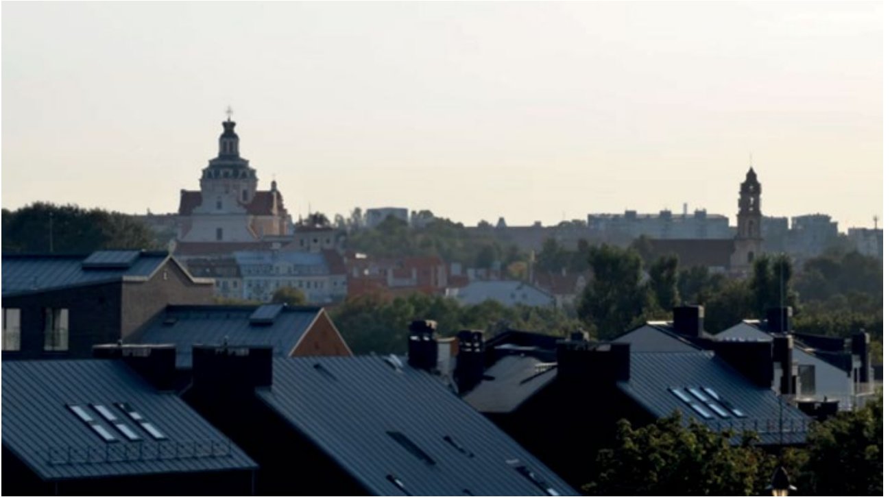
3. Widok na Wilno z okolic dawnego traktu mohylewskiego. Po lewej stronie kościół Jezuitów św. Kazimierza, po prawej kościół Augustianów-Eremitów, Fot. A.S. Czyż, 2018 r.

wysunięte tylko o jeden uskok i obiegające dookoła obramienia, lub są ich całkowicie pozbawione. Szczególnie charakterystycznym motywem jest wprowadzenie krzywej linii w cokołach. Wyżej wymienione cechy charakteryzują obiekty baroku wileńskiego, które Karol Guttmejer przypisał do nurtu lekko archaizującego i bardziej plastycznego.