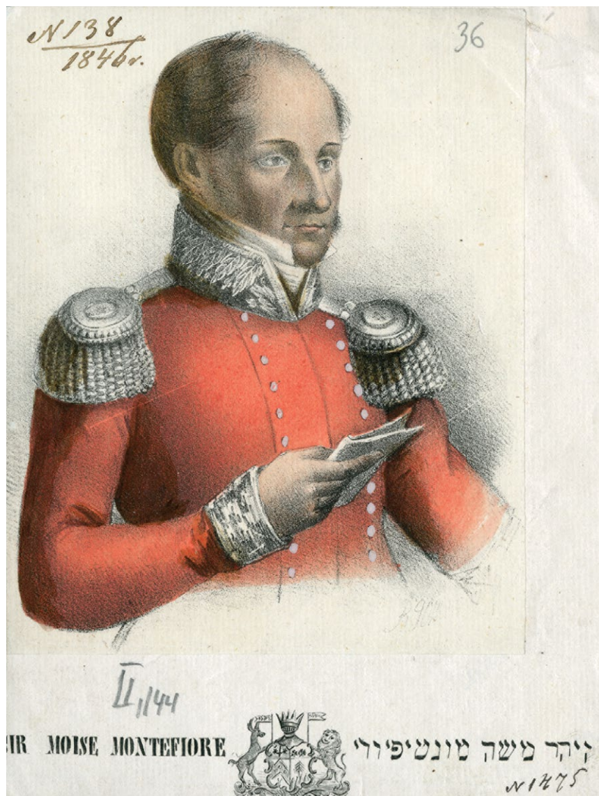
2. Józef Oziębłowski wg Marcellego Januszewicza, Sir Moise Montefiore, 1846 r. VUB Ozij IB-1.

litografii Józefa Oziębłowskiego nie wyszedł, choć są pojedyncze litografie, wyraźnie wykonane na podstawie rysunku lub akwareli Marcellego Januszewicza. Przy okazji można dodać, że w 1844 r. Januszewicz otrzymał pozwolenie na wydanie w litografii Oziębłowskiego Wizerunku cudownego obrazu Matki Boskiej z kościoła Wszystkich Świętych w Wilnie 66 , a w 1846 r., w związku z wizytą w Wilnie Mosesa Montefiore z żoną Judith, Januszewicz wydał