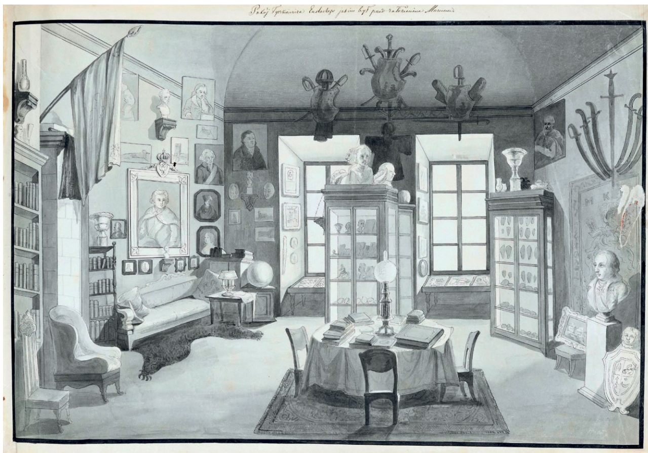
7. Marcelego Januszewicza, Pokój Tyszkiewicza Eustachego jakim był przed założeniem Muzeum, ok. 1845 r. MNW Gr.Pol.6000/67 MNW.

a przed samym przeniesieniem ich do muzeum złożył je w domu Pomarnackiego 83 . Prawdopodobnie na rysunku widzimy wnętrze tego ostatniego mieszkania. Nie wiemy, kiedy Januszewicz poznał Eustachego Tyszkiewicza. Z całą pewnością ogłoszenie prenumeraty Starożytności miasta Wilna nie mogło nie zwrócić uwagi założyciela Muzeum Starożytności, tym bardziej że hrabia troszczył się o dokumentację kolekcji i o wzbogacenie „skarbnicy nauki”, dlatego każdy nowy obiekt chciał ogłosić „rysunkiem, sztychem lub drukiem” 84 .