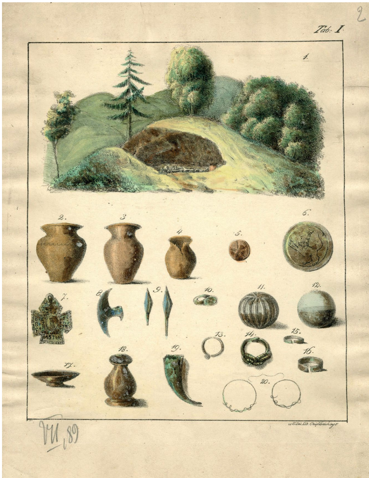
8. Tablica I. litografii Józefa Oziębłowskiego wg Marceliego Januszewicza. Fot. wg. E. Tyszkiewicz, Rzut oka na źródła archeologii..., dz. cyt.