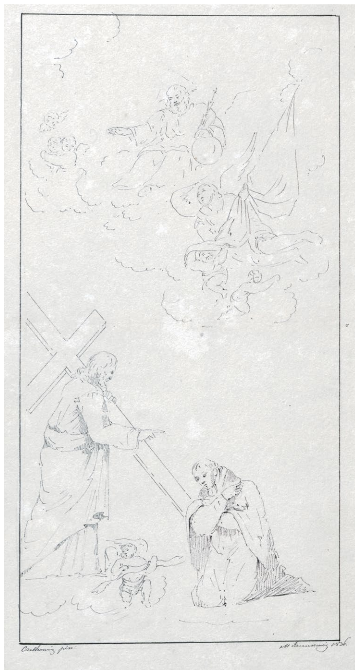
1. Marcin Januszewicz wg Szymona Czechowicza, Wizja św. Ignacego Loyoli , 1836 r. LMAVB f. 320-427.

W Mołodecznie Marcelego Januszewicza wykładał rysunek i kaligrafię.