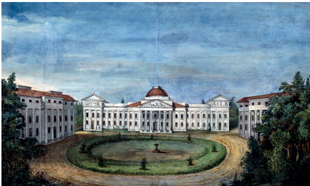
6. Marcei Januszewicz, Werki , ok. 1839 r. LNDM T218.