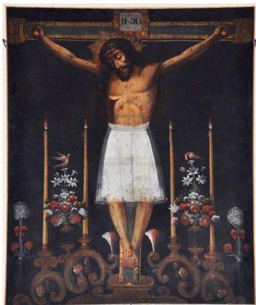
14. N.N., Señor de los Temblores , kaplica dawnego beaterium św. Róży w Cusco, Peru, XVIII w.

wykonano i wysłano do Ameryki na polecenie Karola V. Historia podróży transatlantyckiej i cudownych wydarzeń przypisywanych wizerunkowi Chrystusa utrwała się w zbiorowej pamięci społeczeństwa Cusco w epoce kolonialnej. Tradycję tę ugruntowała relacja w osiemnastowiecznej kronice Diega de Esquivel y Navia 33 , która potwierdza informację o wysłaniu figury Chrystusa Ukrzyżowanego na polecenie Karola V. Obecnie większość badaczy uważa, że figura jest wytworem lokalnym, powstałym po 1560 r. Zazwyczaj przypisuje się ją warsztatom kuzkańskim, wykazuje bowiem zarówno w zakresie formy, techniki, jak i materiałów cechy typowe dla Andów. Jednak istnieją także inne hipotezy dotyczące miejsca powstania rzeźby. Pablo F. Amador Marrero w publikacji z 2020 r. 34 zbiera informacje ze wszystkich wcześniej powstałych