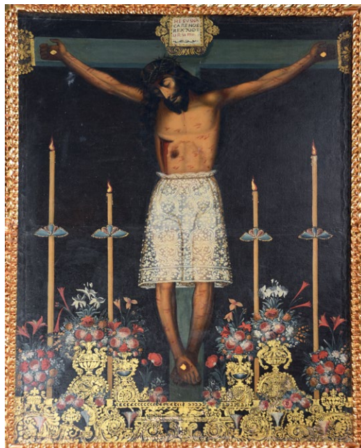
13. N.N., Señor de los Temblores , zakrystia kościoła jezuitów w Cusco, Peru, XVIII w.