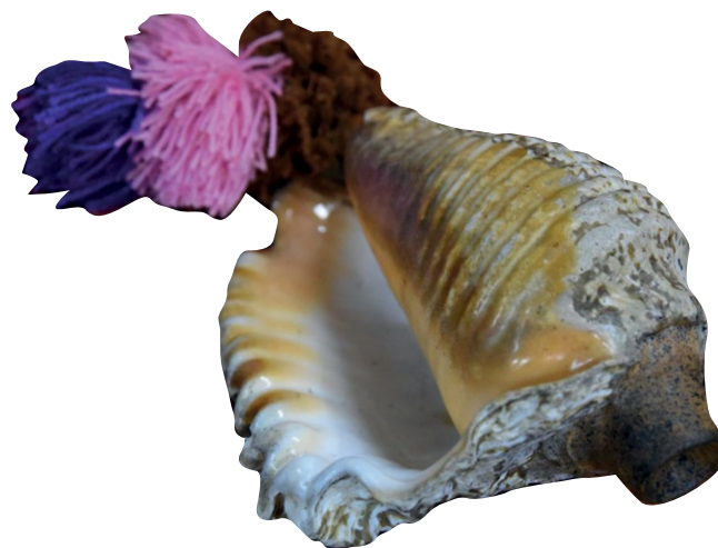
4. Współczesny instrument pututu, sklep instrumentów muzycznych w Meso Inka, Cusco, Peru.