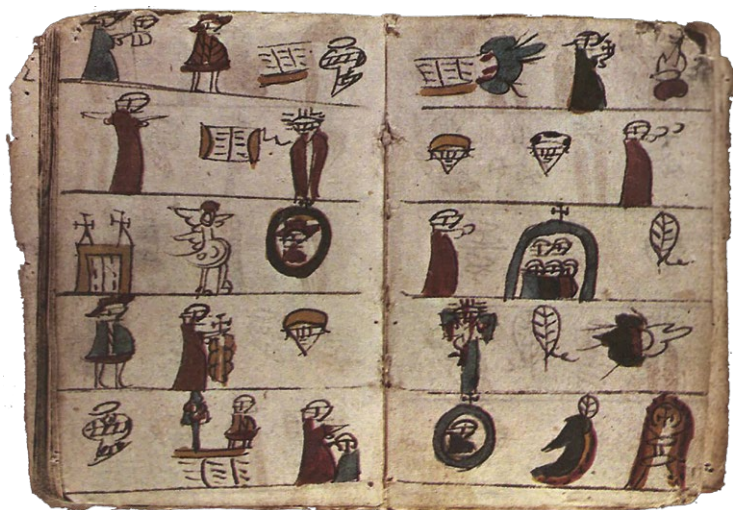
2. Strona z katechizmu Pedro de Gante, XVI w., Biblioteca Nacional de España, Madryt, Hiszpania.