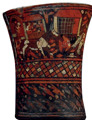
10. Kero z drewna ozdobione sceną figuralną przedstawiającą walkę z bykiem, XVIII w., Museo Inka, Cusco, Peru.