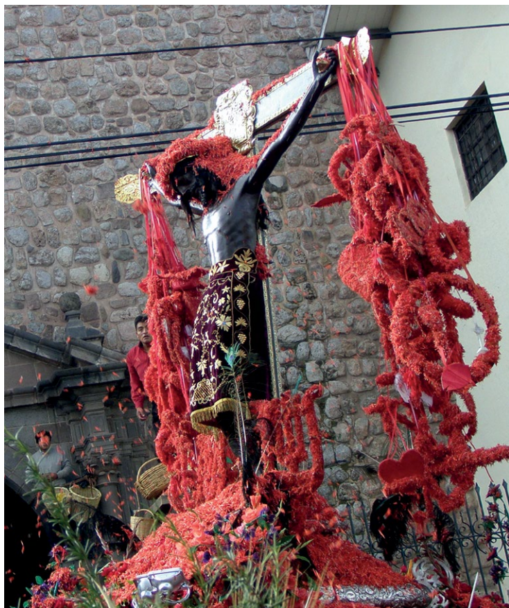
11. N.N., Señor de los Temblores , rzeźba z katedry w Cusco, XVI w., procesja w Wielki Poniedziałek 2010 r., Cusco, Peru.

i zwyczajów tubylczej ludności, które przetrwały czas konkwisty, uległy transformacji i dalej funkcjonowały w czasach kolonialnych.