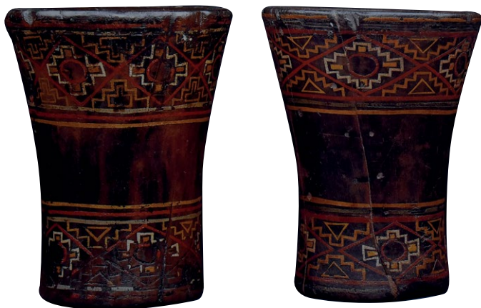
9. Para keros z drewna ozdobionych dekoracją geometryczną (tokapu), XVII w., Museo Inka, Cusco, Peru.