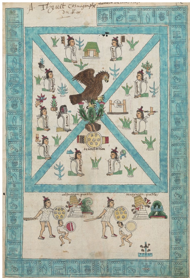
1. Pierwsza strona z „Kodeksu Mendoza”, ok. 1541, Oxford Library, Wielka Brytania.