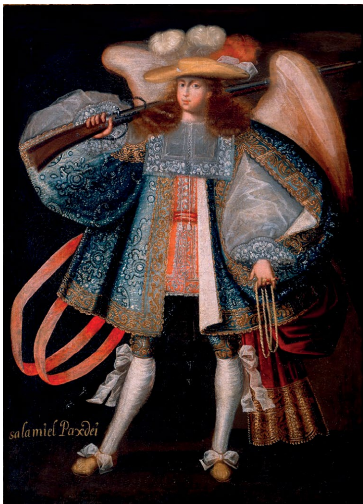
5. N.N., Wizerunek anioła arkebuzera (Salamiel Paxdei), XVII w., Andy Boliwijskie, New Orleans Museum of Art, Stany Zjednoczone.