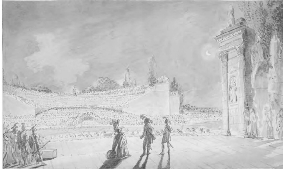
5. Jean-Pierre Norblin de la Gourdaïne, Wystawienie baletu Kleopatra w Łazienkach – Widok zza kulisy sceny Teatru na Wyspie , 1791 r., akwarela, gwasz, Zamek Królewski w Warszawie - Muzeum, nr inw. ZKW-dep.FC/610/ab.