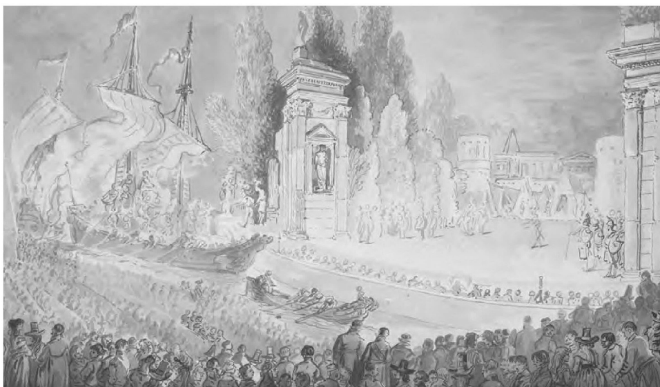
4. Jean-Pierre Norblin de la Gourdain, Wystawienie baletu Kleopatra w Łazienkach – Łodzie przepływające przed sceną Teatru na Wyspie, 1791 r. , akwarela, gwasz, Zamek Królewski w Warszawie - Muzeum, nr inw. ZKW-dep.FC/609/ab.