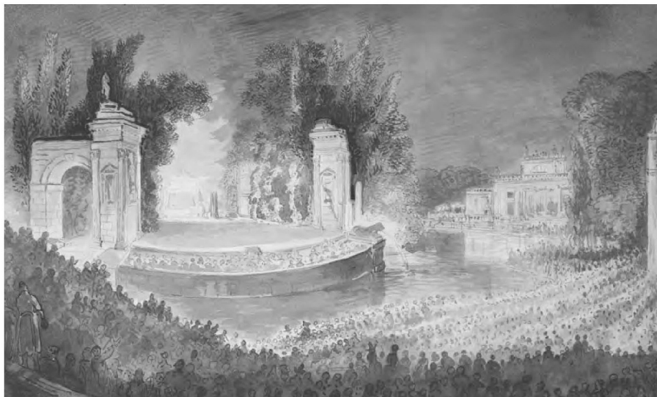
3. Jean-Pierre Norblin de la Gourdain, Wystawienie baletu Kleopatra w Łazienkach – Publiczność oczekująca na występ, w tle scena Teatru i Pałac na Wyspie, 1791 r. , akwarela, gwasz, Zamek Królewski w Warszawie - Muzeum, nr inw. ZKW-dep.FC/608/ab.