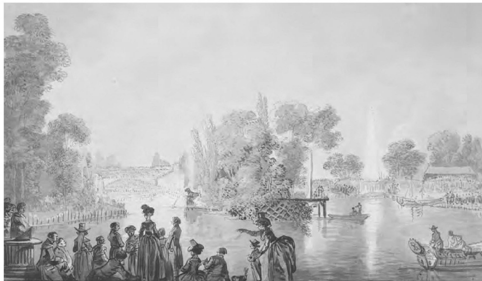
6. Jean-Pierre Norblin de la Gourdaïne, Wystawienie baletu Kleopatra w Łazienkach – Widok na grupę widzów na tle stawu z amfiteatrem w głębi , 1791 r., akwarela, gwasz, Zamek Królewski w Warszawie - Muzeum, nr inw. ZKW-dep.FC/611/ab.