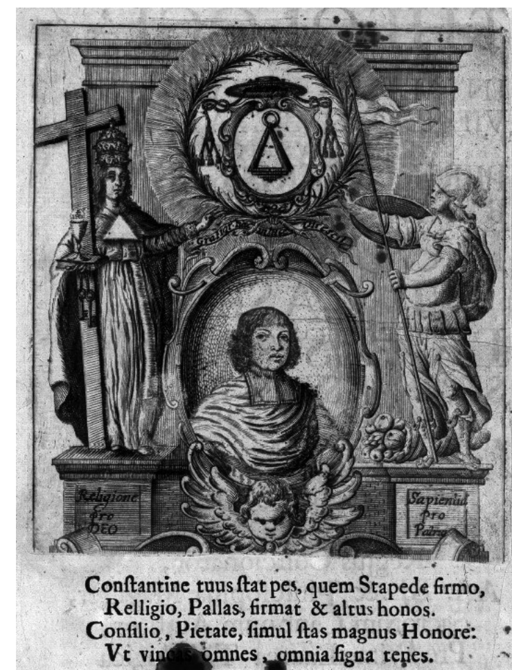
1. Portret Konstantego Kazimierza Brzostowskiego w panegiryku S. Fańciszewskiego Conclusiones ex universa Theologia , 1673 r.