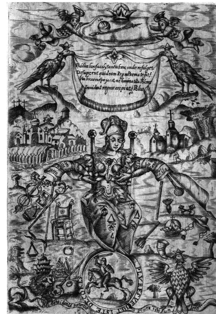
3. Rycina w Verus antistes et prudens , 1687 r.

panegirykami, z których dwa zdobią portrety duchownego. W anonimowym druku ulotnym Verus antistes wydanym w drukarni Akademii Wileńskiej 32 , po karcie tytułowej umieszczono rycinę, przez niektórych