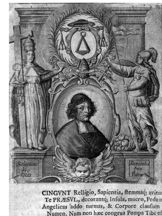
4. Portret biskupa Konstantego Kazimierza Brzostowskiego w panegiriku P. Olekszewskiego Theologicae positiones , 1687 r. Fot. z archiwum autora

z Fałciszewskiego Conclusiones ex universa Theologia , z r. 1673 rycinę, z tą różnicą, że aktualizowano podobiznę duchownego, przedstawiając go już w piusce i z pektorałem, dodano za kartuszem pastorał oraz miecz jako oznaki godności biskupiej, zmieniono także treść inskrypcji objaśniającej. Świadczy to o trwałości i atrakcyjności programu ikonograficznego tego przedstawienia, a nie tylko wygodzie autorów panegiryków z Towarzystwa Jezusowego, co dotąd sugerowano 41 . W wydanym w Wilnie Theologicae positiones de incarnatione verbi de angelis, beatitudine et actibus humanis autorstwa Pawła Olekszewskiego (il. 4), treść podpisu brzmi: „CINGUNT Relligio, Sapientia, stemmaq(ue) avitum / Te PRAESUL, decorant(que), Insula, mucro,