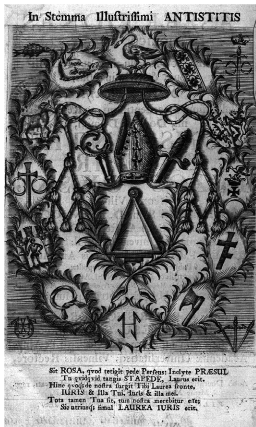
9. Rycina w Assertiones Canonico Legales , 1699 r.

W przypadku herbu złożonego biskupa Brzostowskiego mamy do czynienia z godłami należącymi w większości do niezbyt liczących się rodzin szlacheckich. Wyjątkiem jest herb Druck, który mógł być wyeksponowany ze względu na wysoki status pieczętujących się nim kniaziów Druckich-Sokolińskich, potomków książąt połockich, choć w herbarzach