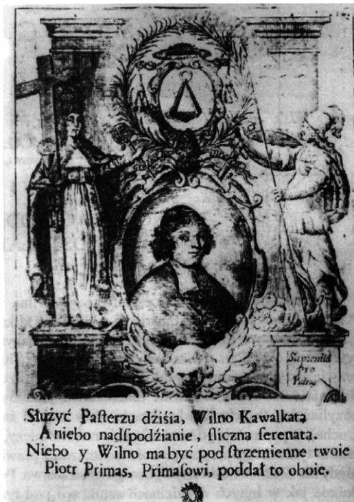
5. Portret biskupa Konstantego Kazimierza Brzostowskiego w panegiryku Cezarego Żochowskiego Applauz szczerzyliwy do Stolicy y Cathedry , 1687 r.