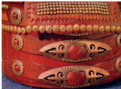
7. Pas bacowski . Fot. wg J. Knab, Skarbiec podtatrzeńskiej sztuki , Warszawa 1977.

Doskonałą bazę dla Spółdzielni stanowiły trzy średnie szkoły artystyczne, działające w Zakopanem. Technikum Budowlane im. Władysława Matlakowskiego kształciło stolarzy i cieśli. Liceum Sztuk Plastycznych