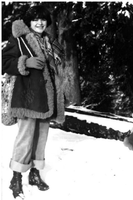
8. Kożuch zaprojektowany i wykonany w ZWW dla polskiej ekipy na X Zimowe Igrzyska Olimpijskie w Grenoble w 1968 r.