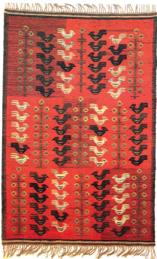
6. Ciąg słonek , kilim, proj. Maria Bujak. Fot. wg J. Knab, Skarbiec podtatrzeńskiej sztuki , Warszawa 1977.

kształciło rzeźbiarzy, projektantów mebli, lutników. Wreszcie: Technikum Tkactwa Artystycznego im. Heleny Modrzejewskiej przygotowywało do zawodu tkaczki, hafciarki, krawcowe. Współpraca między Spółdzielnią a szkołami była bardzo istotna dla obu stron – polegała na zatrudnianiu absolwentów, udzielaniu szkołom pomocy materialnej, kupowaniu prac.