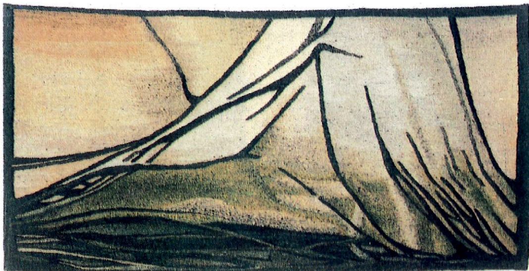
4. Czarny Staw Gąsienicowy , kilim, proj. Helena Sułkowska-Pawlik. Fot. wg Artyści plastycy – projektanci Zakopiańskich Warsztatów Wzorcowych w XXX-lecie działalności , [katalog wystawy], Nowy Targ 1977.