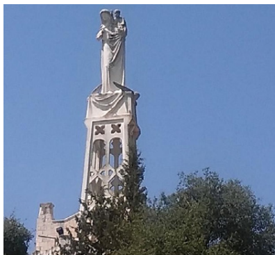
Ryc. 2. Figura Maryi z Dzieciątkiem na Arce Przymierza, wieńcząca kościół Notre Dame de l'Arche d'Alliance

W ostatnich latach w tym niezwykle interesującym miejscu, w którym Biblia umieszcza sanktuarium Arki przed jej przeniesieniem do Jerozolimy, rozpoczęto badania archeologiczne. Istotny jest fakt, że przed ich podjęciem na wzgórzu Kiriat-Jearim przeprowadzono jedynie niewielkie prace wykopaliskowe, zatem to stanowisko archeologiczne przez długi czas pozostawało niemal nietknięte. Przyjrzyjmy się teraz temu zagadkowemu miejscu i spróbujmy odpowiedzieć na pytanie, czy związany z nim przekaz biblijny znajduje odzwierciedlenie w wynikach badań archeologicznych. Interesująca będzie próba wyjaśnienia, przez kogo i dlaczego właśnie Kiriat-Jearim zostało wybrane na siedzibę Arki. Równie intrygujące będzie ponadto odniesienie się do hipotezy, która lokalizuje w tej okolicy starożytne Emaus.