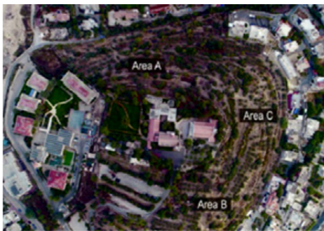
Ryc. 5. Ortofotografia wzgórza Kiriath-jearim z zaznaczonymi obszarami wykopalisk przeprowadzonych w sezonach 2017 i 2019; w centralnej części widoczny kościół oraz zabudowania klasztorne