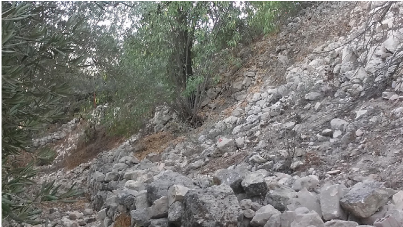
Ryc. 7. Pozostałości murów oporowych jednego z masywnych tarasów wyznaczających szczyt wzgórza. Widok przed rozpoczęciem wykopalisk