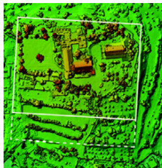
Ryc. 6. Cyfrowy model wzgórza Kiriath-jearim ukazujący przypuszczalny przebieg murów oporowych platformy z epoki żelaza (linia ciągła) oraz jej rozbudowy z okresu rzymskiego (linia przerywana); w części środkowej widoczne współczesne budynki kościoła i klasztoru