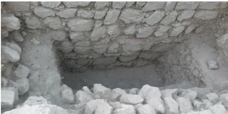
Ryc. 8. Fragment muru oporowego, założonego na podłożu skalnym (jest ono widoczne pod blokami kamiennymi tworzącymi mur w środkowej części fotografii), odkrytego w 2017 r. w obszarze B