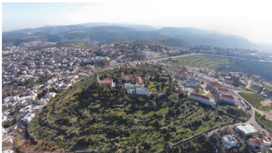
Ryc. 4. Widok na wzgórze Kiriath-jearim od strony północnej