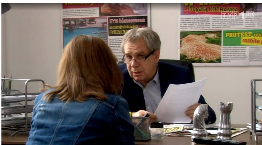
Fot. 4. Gabinet redaktora naczelnego „Super Faktów”, Ranczo So9 Eo6

wywnioskować, że była ona ogólnopolskim brukowcem. Prawdopodobnie autorzy scenariusza nawiązywali do tytułów dwóch działających tabloidów: „Faktu” i „Super Expressu”.