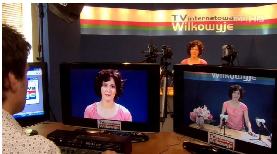
Fot. 9. Oświadczenie Lucy w „Internetowej Telewizji Wilkowyje”, Ranczo So4 E11

w „Internetowej Telewizji Wilkowyje” doszło do alegorycznej i ostatecznej walki „dobra ze złem”. Zwaśnieni bracia bliźniacy nie potrafili porozmawiać jednak twarzą w twarz i kontaktowali się za pomocą nagrań emitowanych przez Witebskiego. Ten konfrontacyjny format wydaje się w ujęciu medialnym powszechny.