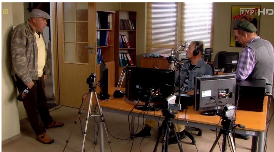
Fot. 6. Audycja Patryka Pietrka z kolegami, Ranczo So8 Eo1