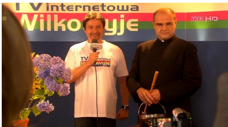
Fot. 7. Otwarcie „Internetowej Telewizji Wilkowyje”, Ranczo So4 Eo8

z perspektywy odbiorcy 75 . Działalność nowego medium rozpoczyna się od transmisji uroczystego otwarcia, oczywiście w obecności proboszcza 76 .