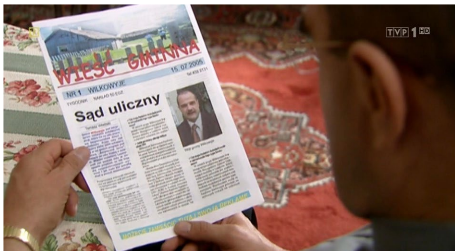
Fot. 1. „Wieść Gminna”, Ranczo So1 Eo6