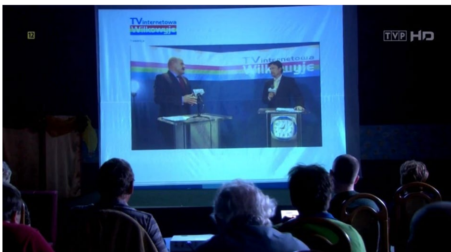
Fot. 8. Debata przedwyborcza, Ranczo So4 E10