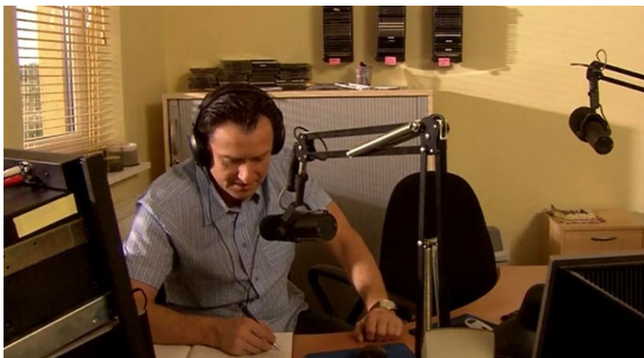
Fot. 5. Siedziba „Radio Wilkowyje”, Ranczo So3 Eo3

on funkcję redaktora naczelnego, nie posiadał jednak siły sprawczej. O tym, co miało pojawić się na antenie, decydował prezes Czerepach. Kres istnienia rozgłośni był związany z wykryciem podsłuchu 65 .