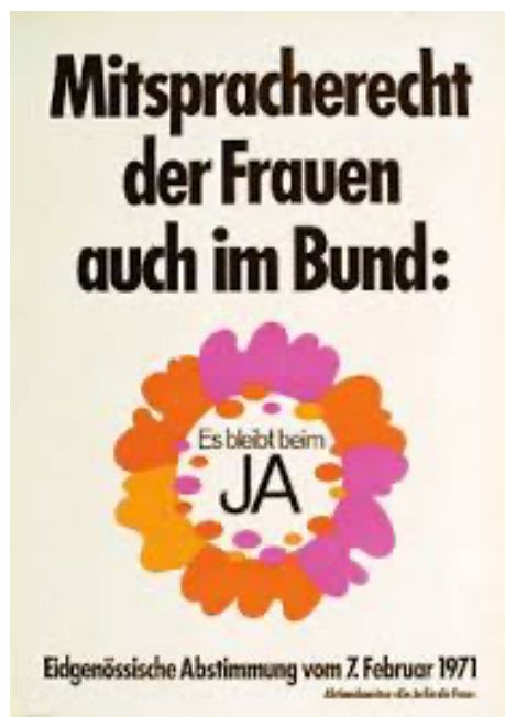
Ryc. 14. Projektant nieznan, Mitspracherecht der Frauen auch im Bund ; rok wydania 1971