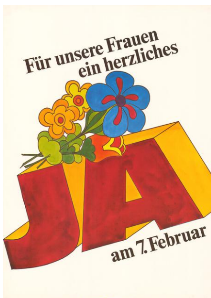
Ryc. 15. Projektant nieznanym, Für unsere Frauen ein herzliches JA ; rok wydania 1971