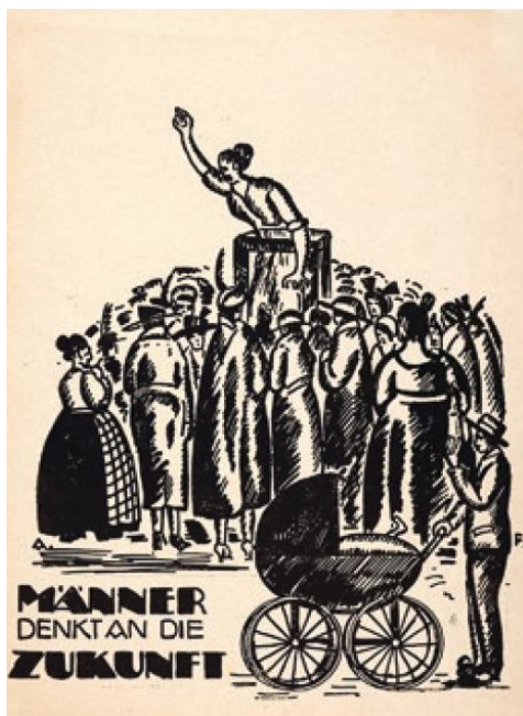
Ryc. 2. Projektant nieznany, Männer denkt an die Zukunft ; rok wydania 1920