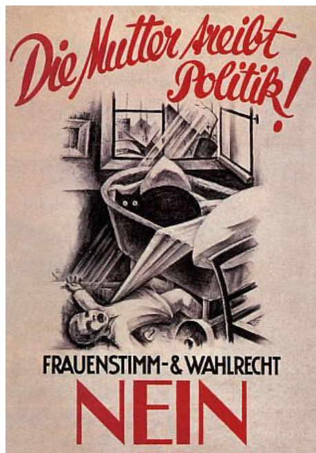
Ryc. 3. Ernst Keiser, Die Mutter treibt Politik! ; rok wydania 1927; miejsce druku Bazylea

świata uosabia kot ze świecącymi oczami w dziecięcym wózku i płaczące niemowlę leżące na ziemi. Plakat sugeruje także, że kobieta poświęcająca swój czas polityce nie tylko nie może być dobrą matką, ale stanowi także zagrożenie dla domowego i społecznego ładu, co ukazuje panujący w domu chaos.