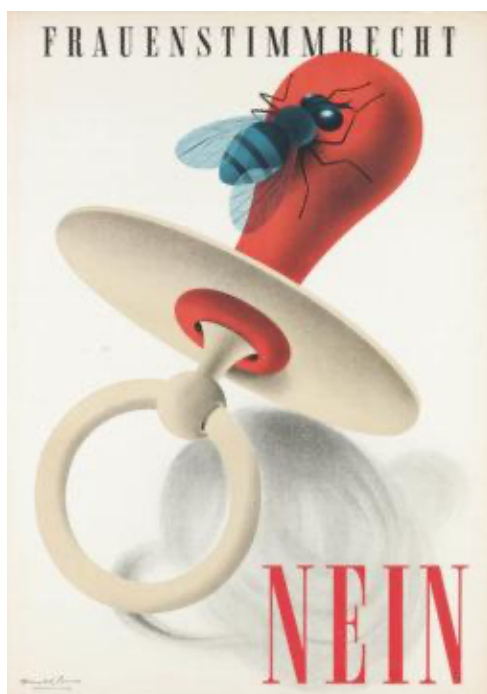
Ryc. 4. Donald Brun, Frauenstimmrecht NEIN ; rok wydania 1946