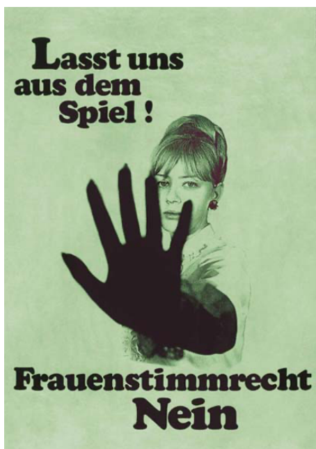
Ryc. 8. Arthur Rahm, Lasst uns aus dem Spiel! ; rok wydania 1968