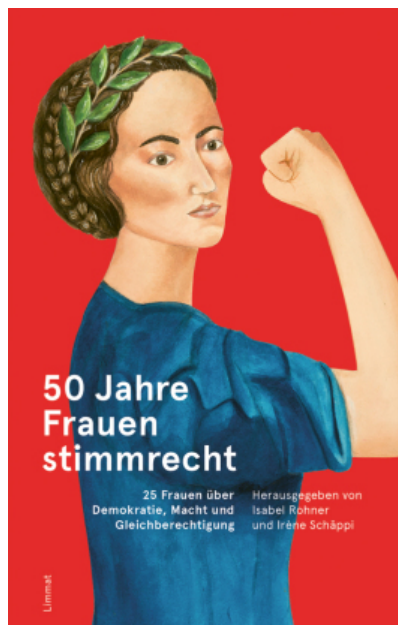
Ryc. 16. Projektant nieznanym, 50 Jahre Frauenstimmrecht ; rok wydania 2020