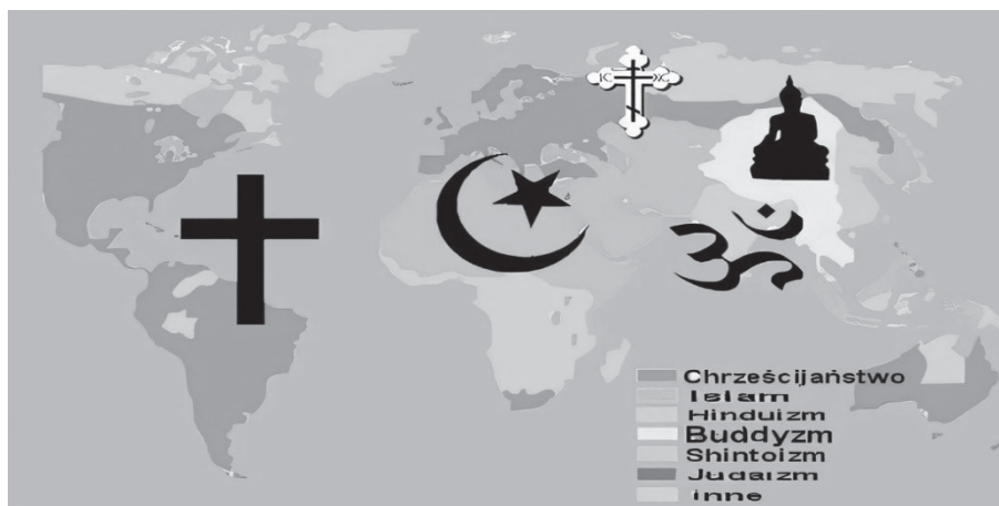
Rys. 2. Symbole największych religii świata

elementu lekcji. Rozpoczyna się edukacja związana z tematem wolności religijnej ukrytej w znaku. Po wykładzie wprowadzającym i aktywizującym, można ukazać młodzieży planszę z symbolami największych religii świata: