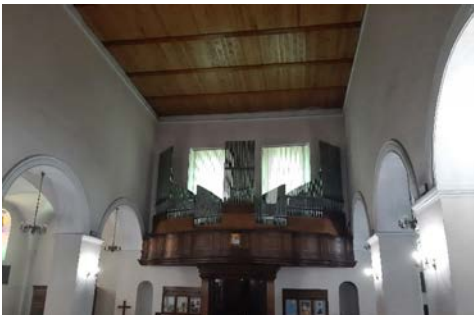
Il. 6. Zakroczym – prospekt.

Połączenia: II-I; II 4'-I; II 16'-I; I-P; II-P. Urządzenia dodatkowe: automat pedałowy; dwie wolne kombinacje; tremolo manualu II. Rejestr zbiorowy: Tutti.