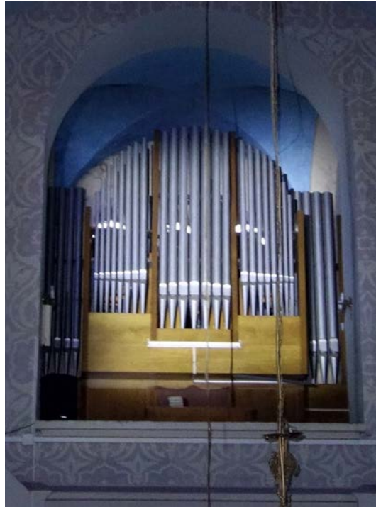
Il. 10. Zielona Mławska – prospekt.

Organy mają realnie 35 głosów (planowane 37), trzy manuały i pedały, mechaniczną trakturę gry, elektryczną trakturę rejestrów i wiatrownice klapowo-zasuwowe. Szafa organowa jest trzykondygnacyjna. Na dolnej kondygnacji, za cokołem prospektu, znajdują się miechy. Na kondygnacji środkowej po lewej stronie sekcja manuału II z prospektową żaluzją, po prawej sekcja pedału. Na najwyższym piętrze po lewej sekcja manuału I, po prawej sekcja manuału III. Stół gry wolnostojący; grający siedzi przodem do prezbiterium. Dyspozycja jest następująca: