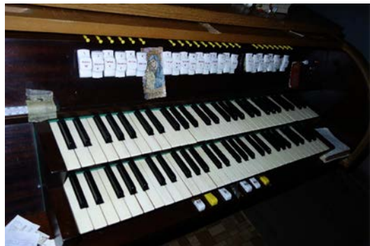
Il. 11. Zielona Mławska – stół gry.