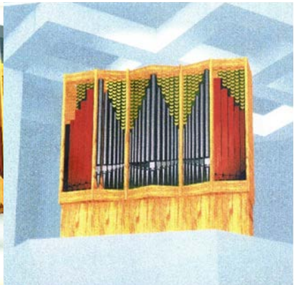
Il. 21. Niezrealizowany wariant prospektu z piszczałkami drewnianymi (AWT Ciechanów).