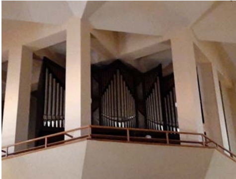
Il. 18. Ciechanów – prospekt.

W archiwum organmistrza zachowało się kilka niezrealizowanych wariantów prospektu, m.in. przewidujące podział na dwie szafy organowe oraz zastosowanie drewnianych piszczałek prospektowych.