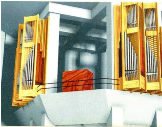
Il. 20. Ciechanów – niezrealizowany wariant prospektu z dwoma szafami organowymi (AWT Ciechanów).