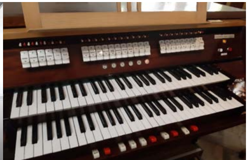
Il. 7. Zakroczym – stół gry.