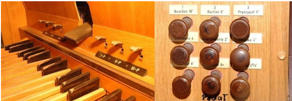
Il. 16. Płońsk – klawiatura pedałowa i dźwignie nożne.