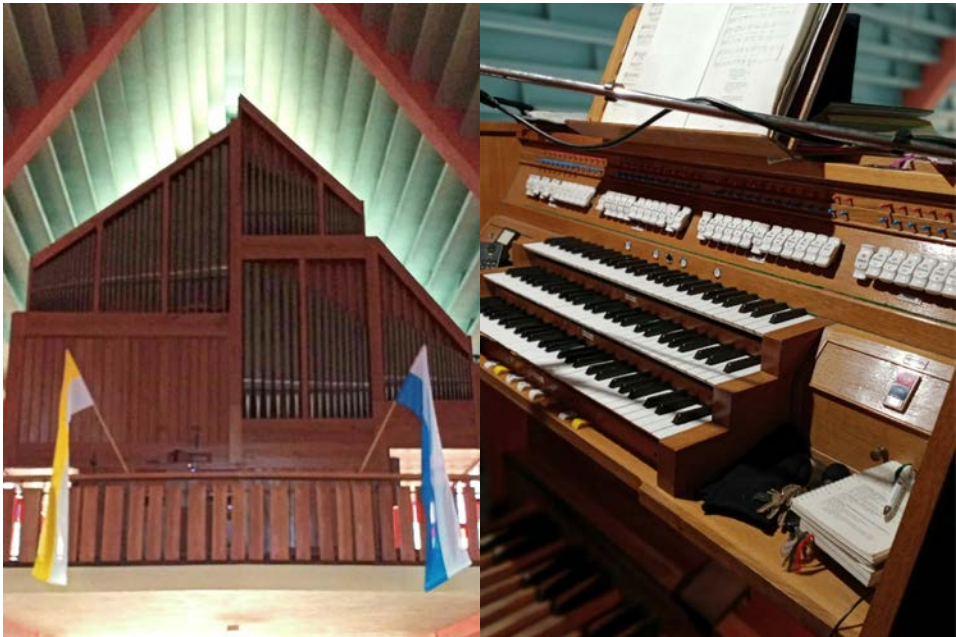
Il. 12. Gostynin – prospekt.

Połączenia: II-I; III-I; III-II; I-P; II-P; III-P. Urządzenia dodatkowe: dwie wolne kombinacje; żaluzja manuału II; włącznik głosów językowych; tremolo manuału II; tremolo manuału III. Rejestr zbiorowy: Tutti.