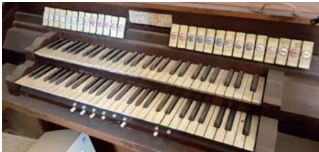
Il. 22. Przasnysz – dawny stół gry.

Połączenia: Połączenie m. II do I; Połączenie man I do ped.; Połączenie man. II do ped.; Super oct. man I; Sub oct man II do I. Urządzenia dodatkowe: Automat pedałow; Wiatr; Tremolo manuału I; Tremolo manuału II; Crescendo. Rejestry zbiorowe: Piano; Mezzoforte; Forte; Tutti.