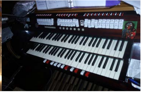
Il. 5. Rypin – stół gry.