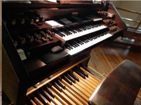
Il. 19. Ciechanów – stół gry.