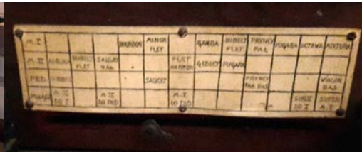
Il. 23. Przasnysz – schemat crescendo w dawnym stole gry.

W 1982 r. Włodzimierz Truszczyński dokonał przebudowy instrumentu. Dyspozycję powiększono do 22 głosów. Wstawiono nowy stół gry, a trakturę zmieniiono na elektropneumatyczną (Narodowy Instytut Dziedzictwa 1986). Rozbudowane organy poświęcono 24 października tegoż roku (Szymanowicz 2012, 394). Zapewne w związku z upływem dziesięcioletniego okresu gwarancji w 1993 r. zakład Truszczyńskiego dokonał przeglądu i niezbędnych napraw (AWT Przasnysz).