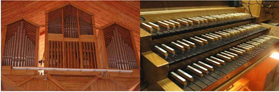
Il. 14. Płońsk – prospekt (fot. Łukasz Zarzycki). Il. 15. Płońsk – manualy (fot. Łukasz Zarzycki).