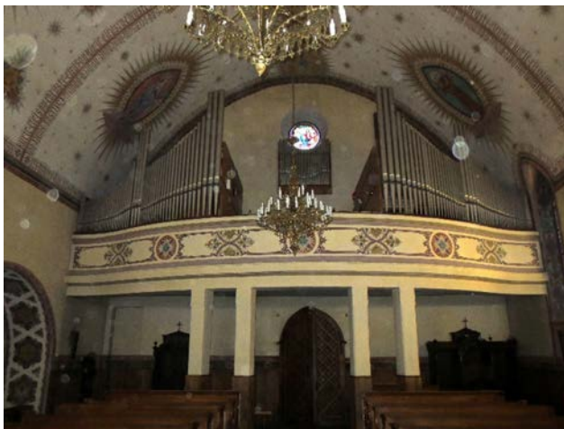
l. 3. Rypin – prospekt przed 2015 r. (fot. Marek Bączek).

Połączenia: II-I; I-P; II-P. Urządzenia dodatkowe: automat pedałowy; dwie wolne kombinacje; crescendo; tremolo manualu II. Rejestry zbiorowe: Forte; Tutti.