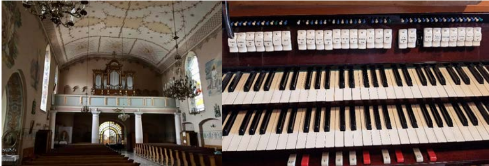
Il. 24. Przasnysz – prospekt.

Połączenia: II-I; Super I; Super II-I; Super II; I-P; II-P. Urządzenia dodatkowe: automat pedałow; dwie wolne kombinacje; crescendo; tremolo manuału II. Rejestr zbiorowy: Tutti.