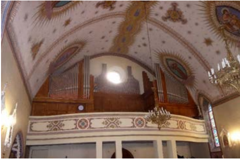
Il. 4. Rypin – prospekt.