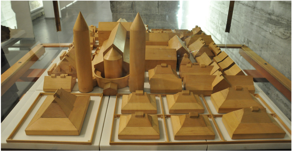
il. 2. Drewniana makietka opactwa przedstawionego na Planie z Sankt Gallen , widok od strony zachodniej z parą wież flankujących wejście do świątyni. Lapidarium opactwa Sankt Gallen, fot. WolfD59.

przestrzeń Raju. Przez dziedziniec zachodni klasztornego założenia prowadzi główne wejście do świątyni. Wejście to flankują dwie wieże poświęcone archaniołom: Michałowi (północna) i Gabrielowi (południowa); na piętrze wież znajdowały się dedykowane im ołtarze (il. 2) 5 . Dwie wieże i dwaj archaniołowie bronią zatem wejścia do rajskiej przestrzeni kościoła, bronią też całego założenia, o czym informuje inskrypcja przy wieży północnej: ad universa super inspicienda . Układ ten odpowiada sytuacji z Księgi Rodzaju, gdy po grzechu i wygnaniu z Raju pierwszych ludzi, Bóg postawił anielską straż u bramy Raju i drogi do Drzewa Życia (Rdz 3,24).