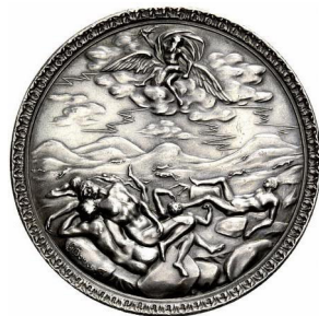
Il. 3. Georg Brower, Medal powstały z inicjatywy Karola II Stuarta pragnącego uświetnić w odpowiedni sposób restaurację monarchii angielskiej , srebro bite, Londyn, 1660; na rewersie ilustracja gromowładnego Jowisza ciskającego piorunami w Gigantów, emitowany z inicjatywy dysponenta królewskiego (władcy brytyjskiego).

Do tematyki mitologicznej nawiązano również na rewersie kolejnego z medali. Należy przypomnieć, iż wspomniane tu dzieło sztuki podnoszące rangę dokonania królewskich Karola XI powstało ok. 1677 roku w warsztacie Antona Meybuscha 4 (Przedmiot wystawiony na aukcji antykwariatu numizmatycznego „Fritz