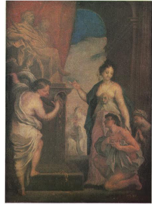
Il. 6. Jan Reisner, Gloryfikacja mecenatu artystycznego Jana III Sobieskiego , płótno, olej, po 1682 (reprodukcja, Chwała i sława Jana III 1983, 136, kat. Nr 18).

18) (il. 6). Fakt identyfikacji osoby Sobieskiego z Jowiszem znajduje potwierdzenie nie tyle w utrwaleniu panującego na podobieństwo starożytnych Rzymian (paludament i wieniec laurowy na głowie), co w ważnym atrybucie towarzyszącym modelowi. Wiązka piorunów, która od zawsze była uważana za symbol władzy i siły została umieszczona w ręku monarchy. Odmienne jest jednak przesłanie propagandowe dzieła. O ile na rewersie medalu autorstwa Schmelzingera Jowisz ciska piorunami w turecki półksiężyc utożsamiany z imperium osmańskim, o tyle na obrazie Reisnera stanowi uosobienie dobrotliwego i opiekuńczego władcy-mecenasa sprawującego osobistą opiekę nad artystą prowadzonym przed oblicze królewskie przez personifikację Imitatio.