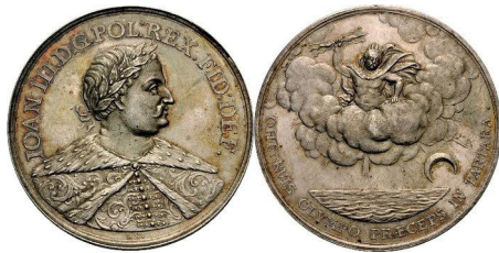
Il. 1. Johann Marten Schmelzinger (Smeltzing), Medal z okazji oswobodzenia cesarskiej stolicy, Wiednia – srebro bite, Leyda, 1683 : na awersie realistyczny portret królewski, na rewersie postać Jana III Sobieskiego identyfikowanego z gromowładnym Jowiszem ciskającym pęk piorunów w kierunku spadającego półksiężycza, emitowany z inicjatywy dysponenta królewskiego.

W czasach najbliższych Sobieskiemu nie sposób nie zatrzymać się dłużej nad jednym z najsłynniejszych konterfektów doby nowożytnej, który posiada wiele cech wspólnych z medalierskim wizerunkiem Jana III Sobieskiego i stanowi pośredni, lecz bardzo ważny, punkt odniesienia dla wielu późniejszych artystów – malarzy, rytowników, rzeźbiarzy – pracujących na ówczesnych dworach europejskich. Mowa w tym miejscu o dziele malarskim pędzla Charlesa Poersona 2 , który uwiecznił w 1655 roku na płótnie kilkunastoletniego Ludwika XIV (Paryż, Wersal,