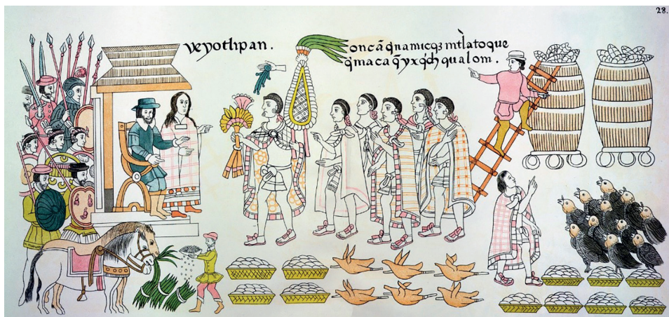
Przybycie Cortésa do Hueyotlipan i spotkanie z jego władzami ( Lienzo de Tlaxcala 1552), http://www.latinamericanstudies.org/tlaxcala/Tlaxcala-lienzo-13.jpg (13.02.2019).