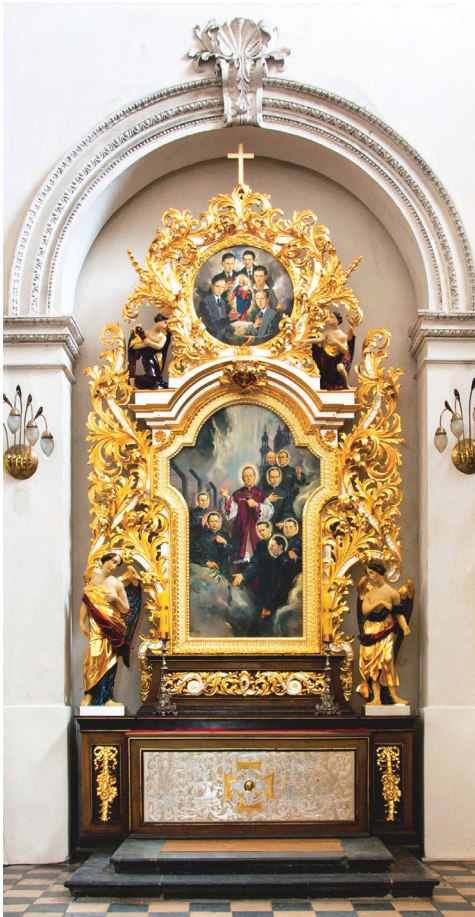
Il. 4. Ołtarz Męczenników II Wojny Światowej w Łądzie w 2013 r., akantowa nastawa i rzeźby po konserwacji.