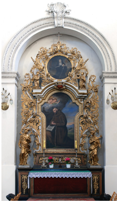
Il. 1. Akantowy ołtarz św. Franciszka z Asyżu w Łądzie, fotografia z maja 2007 r.