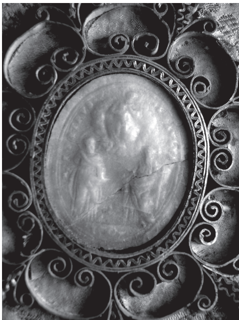
3. Agnusek Klemensa XI z 1707 r. (rewers), Łąd nad Wartą, tablica relikwiarzowa 1. tercja XVIII w.