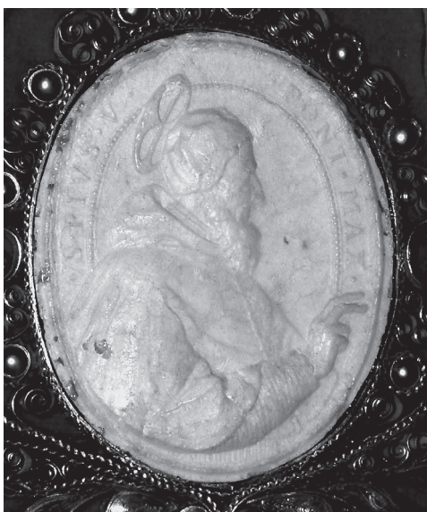
4. Agnusek Klemensa XI z 1714 r. (rewers z wizerunkiem św. Piusa V), kościół SS. Wizytek w Warszawie, predella bocznego ołtarza św. Alojzego Gonzagi.