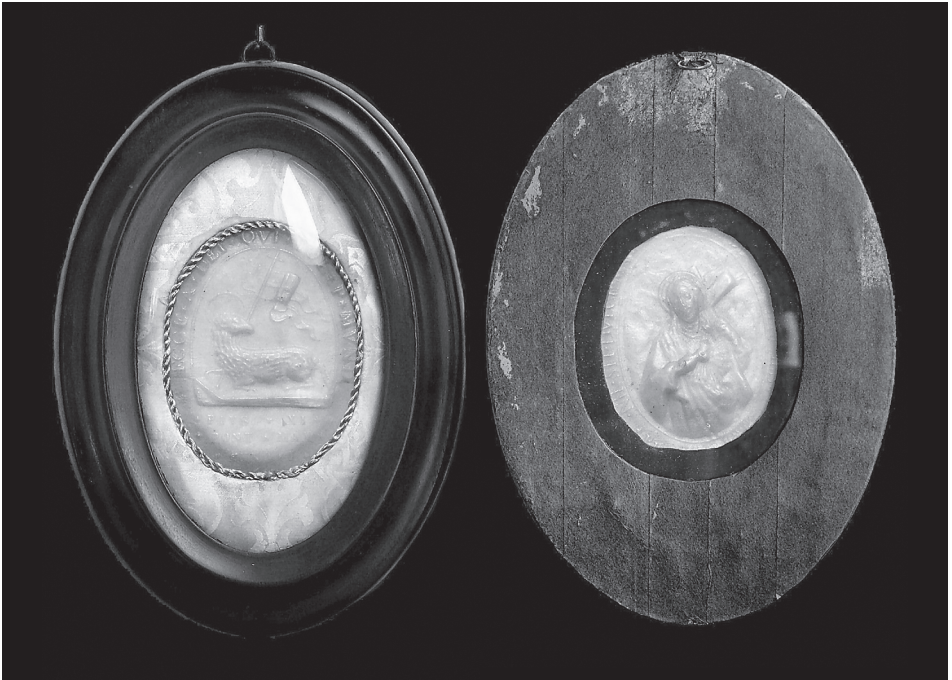
11. Agnus Dei Piusa XI z 1922 r. w ramiarskiej oprawie, kolekcja prywatna.