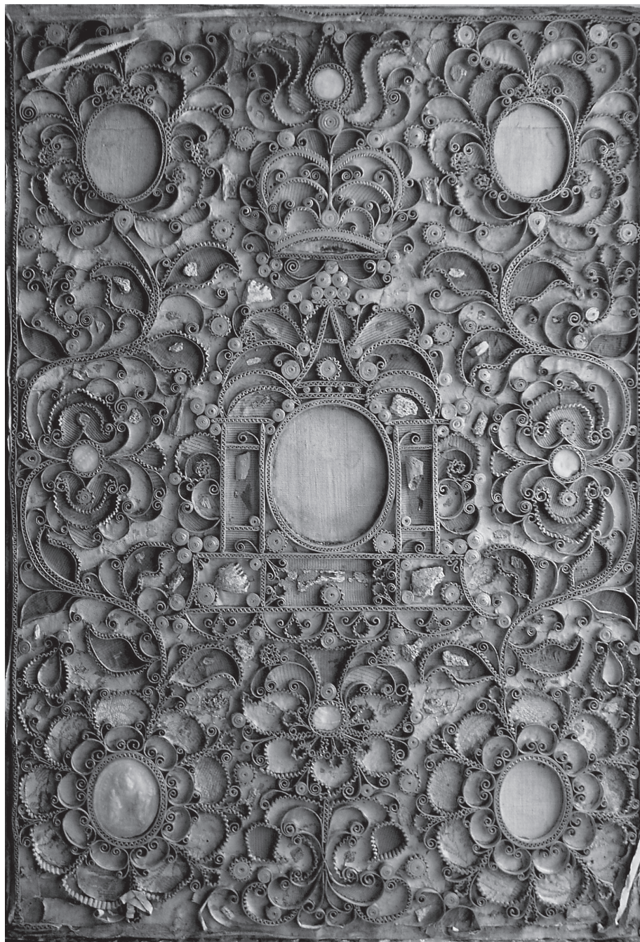
9. Tablica relikwiarzowa z zachowanym Agnus Dei Klemansa XI, 1. tercja XVIII w., Łąd nad Wartą, Biblioteka Wyższego Seminarium Duchownego.