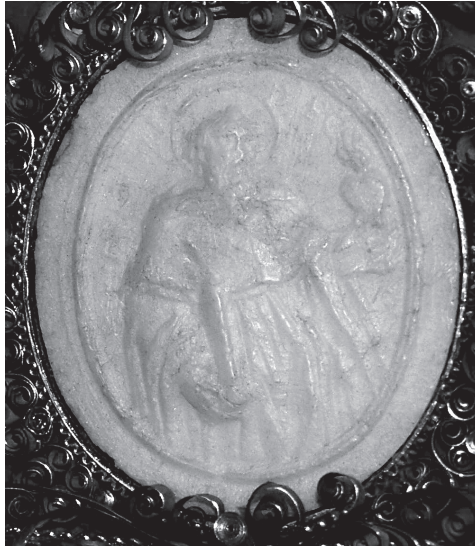
5. Agnusek z wizerunkiem św. Augustyna na rewersie, kościół SS. Wizytek w Warszawie, predella bocznego ołtarza św. Alojzego Gonzagi.