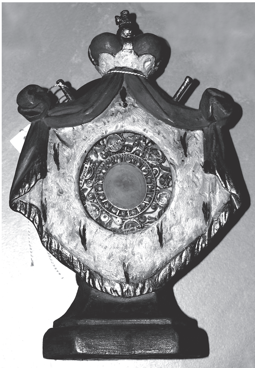
7. Pacyfikał z Agnuskim i relikwiami – tzw. „Relikwiarz Sanguszków”, 1732 r., Muzeum Prowincji OO. Kapucynów w Zakroczymiu.