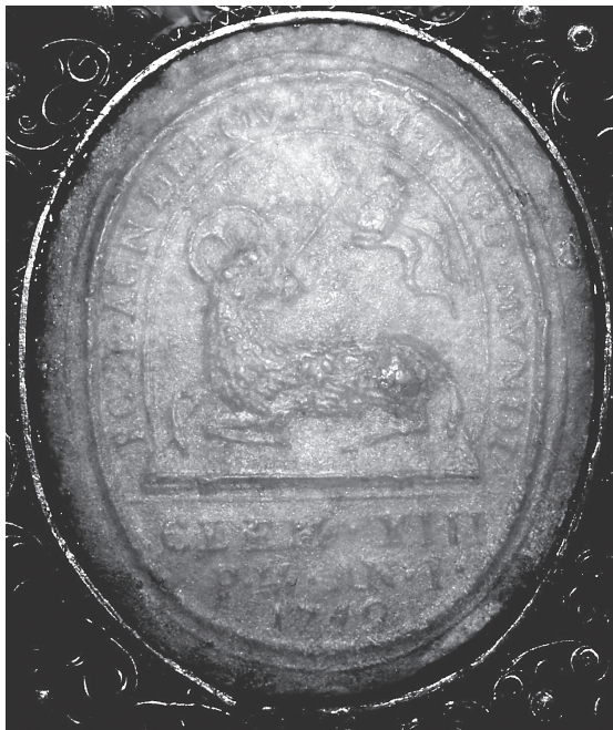
2. Agnusek Klemensa XIII z 1759 r. (awers), kościół SS. Wizytek w Warszawie, predella bocznego ołtarza.