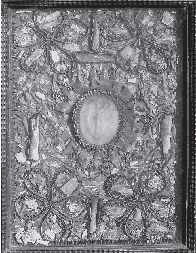
8. Tablica relikwiarzowa z Agnus Dei Innocentego X, poł. XVII w., Czerwińsk nad Wisłą Bazylika Zwiastowania NMP.