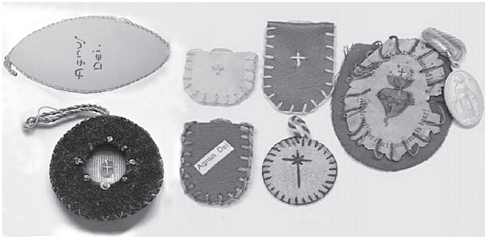
12. Różne formy tekstylnych pakiecików z partykułami Agnus Dei , 1. poł. XX w.