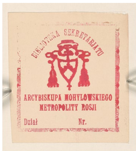
Fot. 4. Biblioteka Sekretariatu Arcybiskupa Mohylewskiego metropolity Rosji, pieczętka; 5,7 × 5,7 cm.