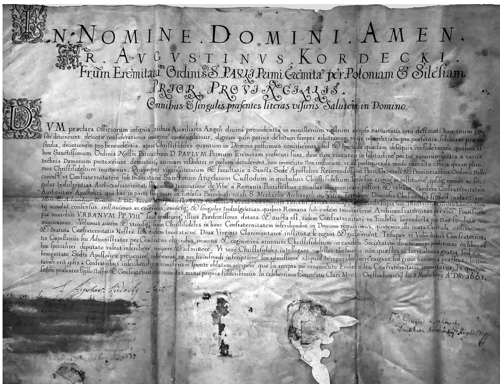
Fot. 1. APBK, dok. perg., b. sygn. 1661, 3 czerwca, w Częstochowie, k. 1

Zbudniewek J., Kordecki Augustyn OSPE, imię chrzestne Klemens, ur. 16 XI 1603 w Iwanowicach ,