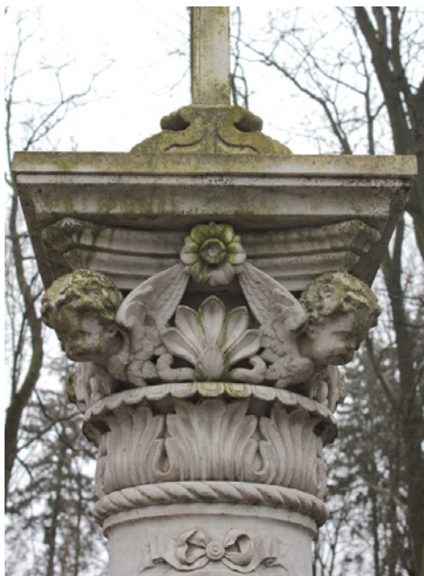
2. Kapitel z nagrobka Jewgienija Rożnowa, cmentarz prawosławny w Warszawie, ok. 1876.