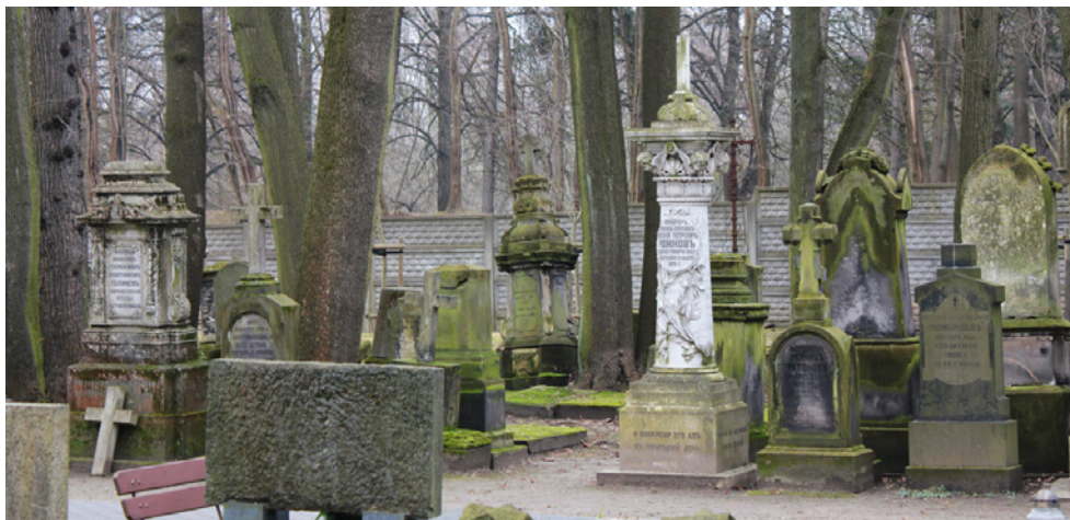
1. Grupa nagrobków na cmentarzu prawosławnym na Woli – kw. 42.

ВОЗМЕТЪ ОТЪ ВАСЪ. //, z przodu: И ВОСКРШУ ЕГО АЗЪ / ВЪ ПОСЛѢДНІЙ ДЕНЬ. //, na prawym boku: ВЪРУЯЙ ВЪ МЯ, ИМАТЬ / ЖИВОТЪ ВѢЧНЫЙ. // i na tylnej ścianie: НѢСТЬ БОГЪ–БОГЪ МЕРТВЫХЪ, / НО БОГЪ ЖИВЫХЪ. //