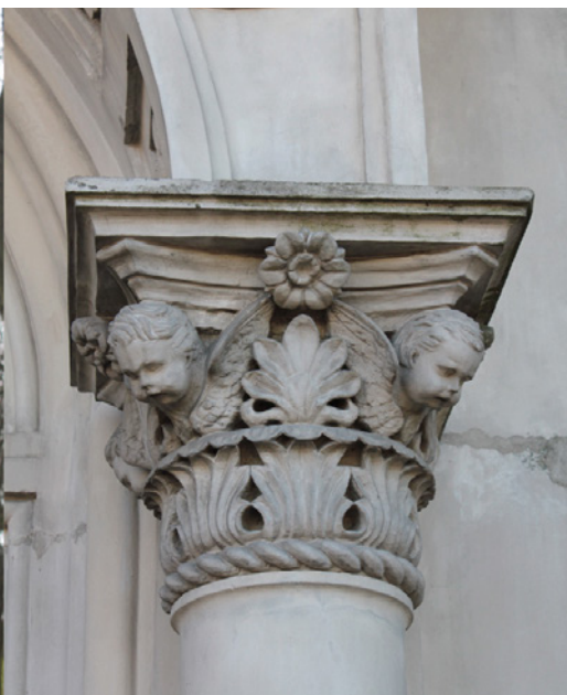
3. Kapitel z portalu kaplicy Blochów, Cmentarz Powązkowski w Warszawie, ok. 1874-1878.