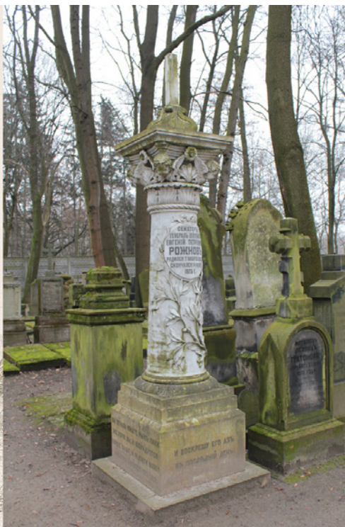
6. Nagrobek Jewgienija Rożnowa, cmentarz prawosławny w Warszawie, ok. 1876.

kolumny i oplatającą go dekoracją złożoną z gałązek i liści oliwnych, lecz wieńczącemu kolumnę popiersiu kobiety, na której głowie znajduje się korona z wawrzynu ozdobiona gwiazdą pośrodku, została podporządkowana cała kompozycja i wymowa ideowa pomnika.