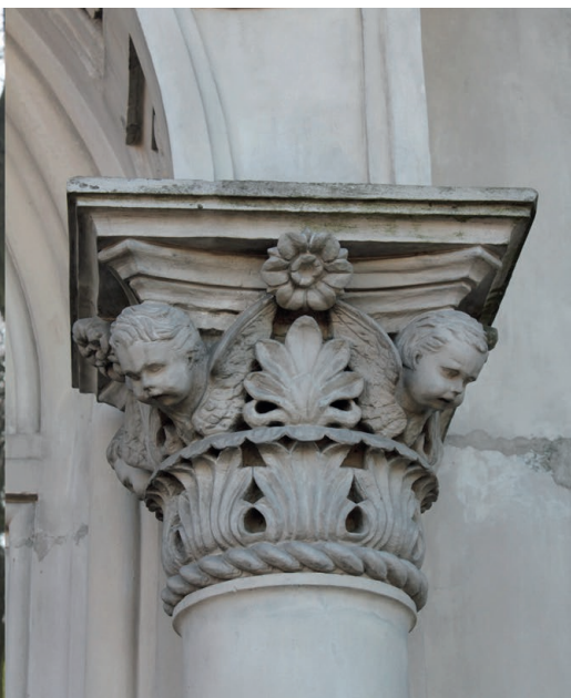
3. Kapitel z portalu kaplicy Blochów, Cmentarz Powązkowski w Warszawie, ok. 1874-1878.