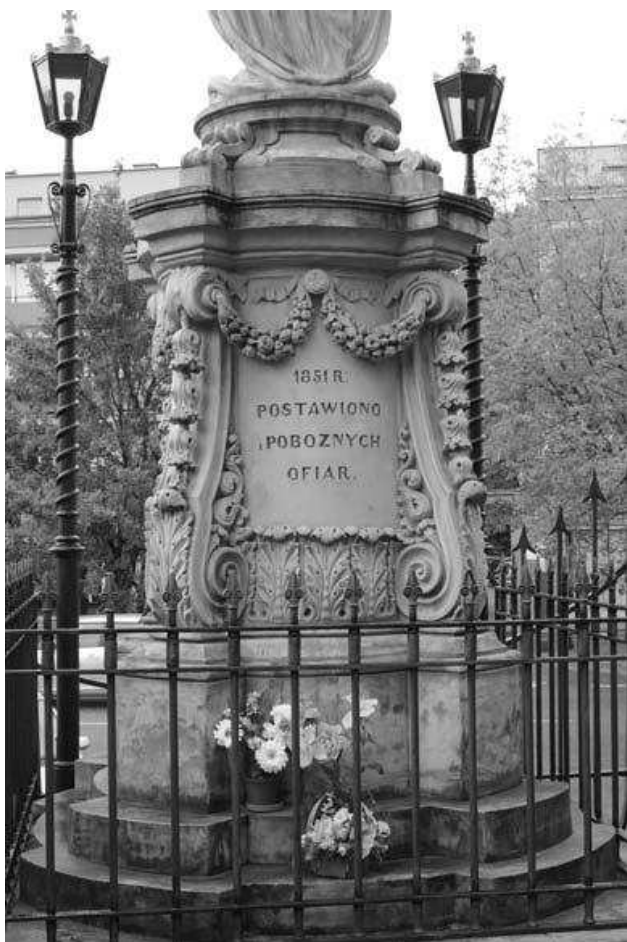
il. 2. Cokół pomnika NMP Niepokalanie Poczętej przed kościołem reformatów w Warszawie, 1851.

typ pomnika grobowego w formie krzyża ustawionego na ozdobnym postumencie. Cokół ten, utrzymany w stylistyce późnobarokowej, ma kształt cylindra zwężającego się nieznacznie ku górze, który ustawiono na szerszej trzystopniowej podstawie i zwieńczył drobno profilowanym gzymsem. Jego trzon ozdabiają cztery narożne woluty o końcach zwiniętych spiralnie do wewnątrz na dole i na zewnątrz u góry. Podparcie dla wolut stanowią zagiełowate partie gzymesu i podstawy, które formują na ich osi prostokątne występy. Grzbiety konsol dekorowane są kampanulami tworzącymi zwisy do dwóch trzecich wysokości. Wybrzuszenia znajdujących się na dole wolut zostały ozdobione liśćmi akantu, występującymi również u podstawy cokółu. Górny pas dekoracji tworzą podwójne girlandy kwiatowe, rozpięte pomiędzy wolutami i podwieszane wstążką do ozdobnego kołka, który umieszczono