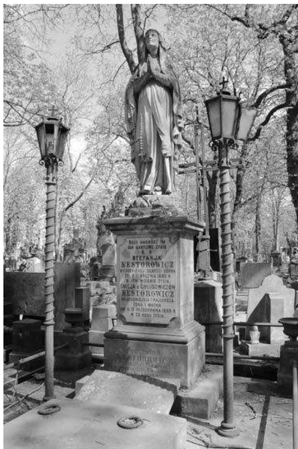
il. 1. Nagrobek Nestorowiczów na Powązkach w Warszawie, ok. 1887.

Poza Warszawą podobne rozwiązanie zostało wykorzystane w tym czasie w Częstochowie przy oświetleniu obrazu Matki Boskiej (1854/1855), znajdującego się na zewnętrznej elewacji, w szczycie kaplicy, w której mieści się cudowny wizerunek Bogarodzicy. Zamówienie