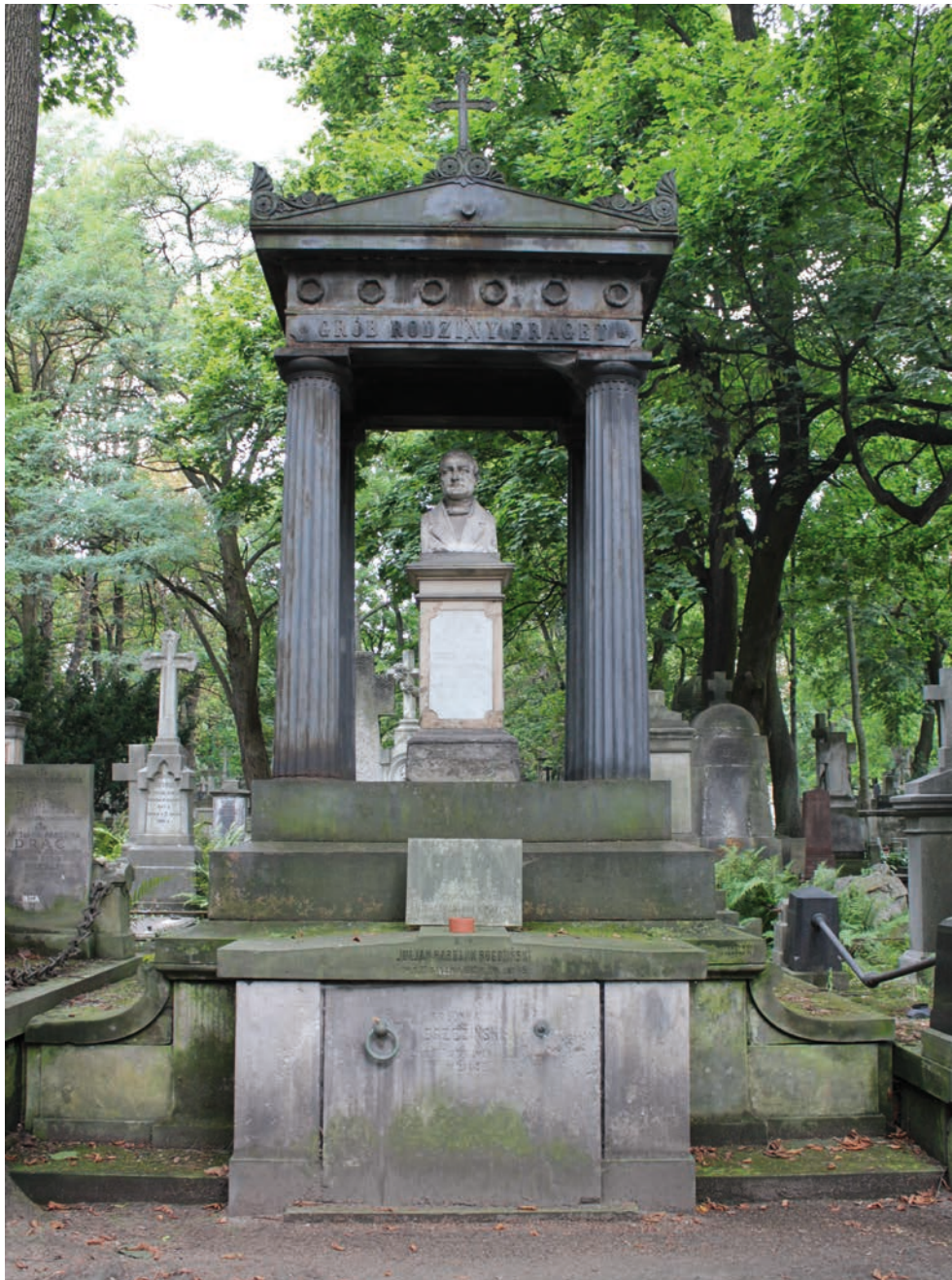
il. 1. Mauzoleum J. Frageta na Powązkach w Warszawie.