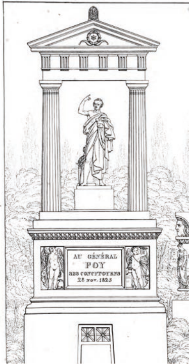
il. 3. Pomnik M. S. Foy na Pere Lachaise w Paryżu, 1832, lit. F. Quaglia