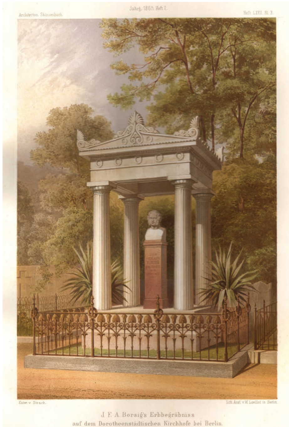
il. 2. Pomnik J. A. Borsiga na cmentarzu św. Doroty w Berlinie, 1865, lit. W. Leoyllot wg. proj. arch. J. H. Stracka