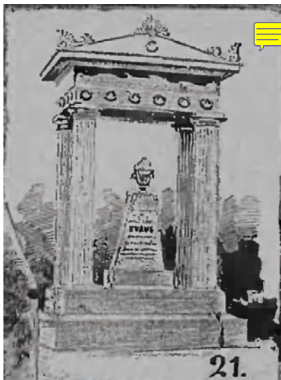
il. 5. Mauzoleum T. Evansa na cmentarzu ewangelicko-reformowanym w Warszawie, 1888, rys. J. Maszyński