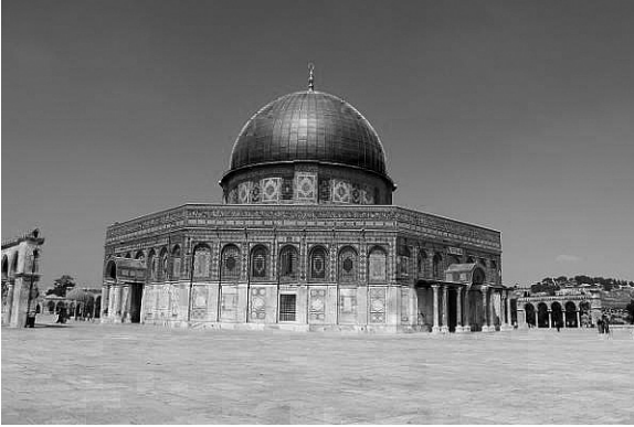
il. 1. Kopiała Skały (źródło domena publiczna)