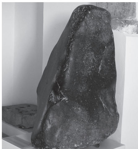
Fig. 5. Kamień kultowy (tzw. betyl) ze świątyni Afrodyty w Palaepaphos na Cyprze (wys. 122 cm)

Główna świątynia fenickiej Astarte na Cyprze znajdowała się w Kition, stanowisku położonym na południowym wybrzeżu Cypru. Naturalna zatoka oferowała dobry port, a znajdujące się w pobliżu słone jezioro mogło zapewnić wewnętrzny port poprzez żeglowny kanał,