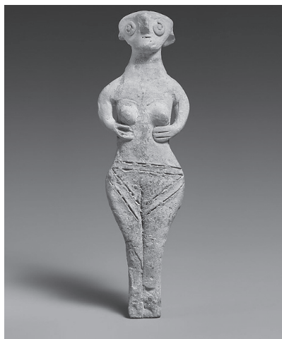
Fig. 3. Cypryjska figurka terakotowa, w typie o tzw. normalnej twarzy (XIV-XIII w. p.n.e., wys. 15,9 cm), Metropolitan Museum of Arts

Sanktuarium I położone jest na południe od rzymskich zabudowań. Zachowała się zachodnia część temenosu o długości 28 m i południowa na 4,5 m, wykonana z gładko wykończonych wapiennych ortostatów o wysokości 2 m i długości 5 m, osadzonych na mniejszych, poziomo ułożonych, wapiennych blokach. Północno-zachodnia ściana temenosu łączy się