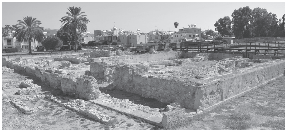
Fig. 6. Świątyni I w Kition na Cyprze, poświęcona bogini Astarte, fot. Katarzyna Zeman-Wiśniewska

dojrzałą kobietę 58 . W Kato Symi odbywały się także rytuały inicjacji dla młodych mężczyzn, potwierdzające częściowo powyższą teorię 59 .