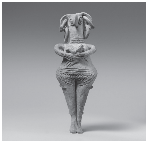
Fig. 2. Cypryjska figurka terakotowa, w typie o tzw. ptasiej twarzy (XIV-XIII w. p.n.e., wys. 20,8 cm), Metropolitan Museum of Arts

Najbardziej oczywiste różnice polegają na sposobie przedstawienia postaci kobiecej, widać długi strój zamiast nagości oraz nowy charakterystyczny gest zastępujący ramiona ułożone wzdłuż ciała lub złożone pod biustem. Zmieniły się także znaczenie i funkcja statuetek, na co wskazuje ich kontekst archeologiczny. Późnocypryjskie figurki terakotowe kojarzone są głównie z pochówkami (typy o ptasiej i o normalnej twarzy) czy osadami (idole mykeńskie), natomiast GWUA składane były w sanktuariach. Nie należy jednak pomijać niektórych podobieństw, które są ważnymi oznakami ciągłości w kulturze cypryjskiej. GWUA, podobnie jak wcześniejsze figurki, w większości przedstawiają postacie kobiece, a ich rysy twarzy i malowane dekoracje częściowo odpowiadają stylowi terakot o tzw. „normalnej twarzy”. Wykazują one również wiele podobieństw z większymi mykeńskimi figurami kultowymi 35 . Znaczenie biżuterii w postaci malowanych zawieszek lub przepasek na ramionach i szyi jest nadal widoczne. Ukośne linie, obecne z przodu lub z tyłu tułowia figurki, stanowią ciekawe