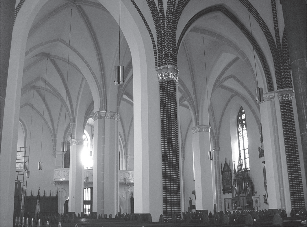
Ryc. 4. Głubczyce, kościół parafialny, widok wnętrza ku zachodowi

kościółem przez króla Wacława II w akcie z 30 sierpnia 1302 roku 47 . Kolejne dokumenty sugerujące prawdopodobne ukończenie przebudowy zawierają: nadanie szpitalnikom nieznanego przywileju przez księcia Mikołaja II z 3 lutego 1349 roku 48 ; fundację mszy przy ołtarzu p.w. Ciała Chrystusowego przez mieszczanina głubczyckiego Heinko 49 oraz informację o ołtarzu p.w. św. Jana Chrzciciela z 1350 roku 50 . Zrealizowany we wspomnianym okresie zakres prac objął przebudowę i powiększenie prezbiterium, zmianę układu przestrzennego korpusu oraz powiększenie wnętrza w przyziemiach wież.