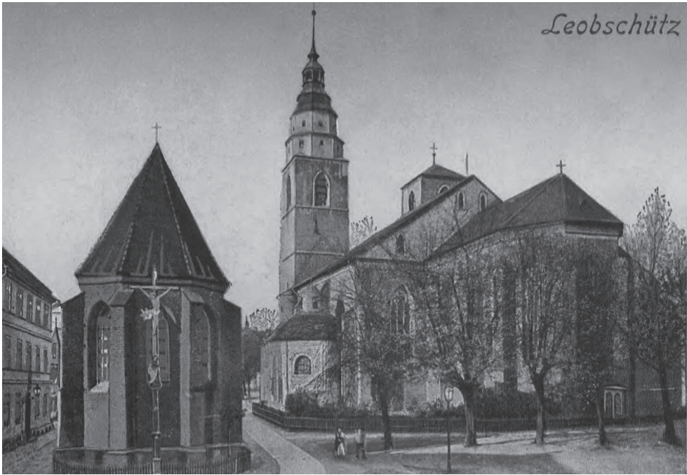
Ryc. 1. Głubczyce, kościół parafialny, widok od wschodu sprzed 1903 roku, widokówka (AMPG)

z prezbiterium i transept nakrywają dachy dwuspadowe z sygnaturką na skrzyżowaniu, a przybudówki po wschodniej stronie transeptu – dachy pulpitowe. Wszystkie one oraz hełmy wież mają pokrycie wykonane z blachy miedzianej.