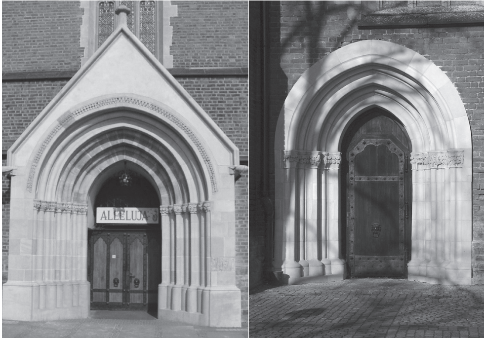
Ryc. 3a, 3b. Głubczyce, kościół parafialny, portal zachodni (a), portal południowy (b), (fot. autor)

bocznych otwierały się arkadami pomieszczenia w przyziemiu westwerku. Przedśionek oraz dwa aneksy – kaplice pod każdą z wież – nakrywały sklepienia krzyżowo-żebrowe rozdzielone szerokimi gurtami. Kamienne elementy dekoracyjne spływały na znajdujące się w narożach głowice kostkowe umieszczone na trzonach niskich półkolumniek z płaskimi bazami. Ich profil tworzył także cokół obiegający wewnętrzne ściany. Ściany obwodowe wzniesiono na kamiennym cokole dwoma uskokami. Elewacje w zasięgu prezbiterium i korpusu opięto przyporami prostopadłymi w narożach. Skarpy wzdłuż ścian naw miały jeden uskok. Pomędzy przyporami umieszczono niewielkie okna doświetlające wnętrze. Nieco inaczej ukształtowano dekorację zakrystii – tu elewację opięto lizenami.