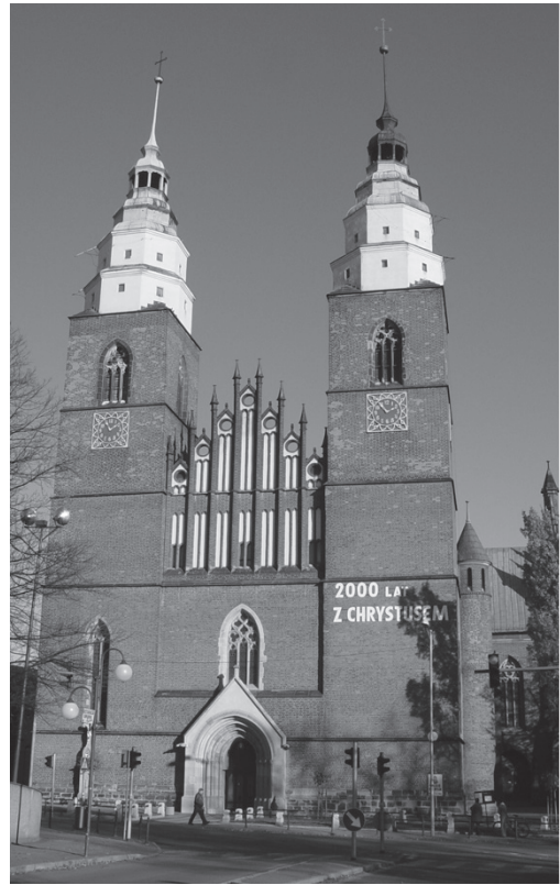
Ryc. 2. Głubczyce, kościół parafialny, widok od zachodu