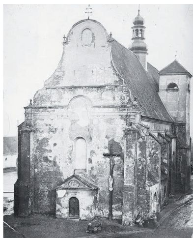
Kościół pw. św. Jakuba w Raciborzu przed 1874 r. Narodowe Archiwum Cyfrowe, 3/8/0/209/341.

Najazd i okupacja szwedzka w latach 1632-1634 spowodowały ogromne zniszczenia kościoła i konwentu w Opolu. Splądrowano wnętrza, a budynki zostały zrujnowane. Pomimo to, w 1635 r. dominikanie powrócili. Dokonali częściowych remontów. Jako jedną z pierwszych odbudowali najstarszą budowlę zespołu – kaplicę św. Wojciecha, która wznosiła się przy