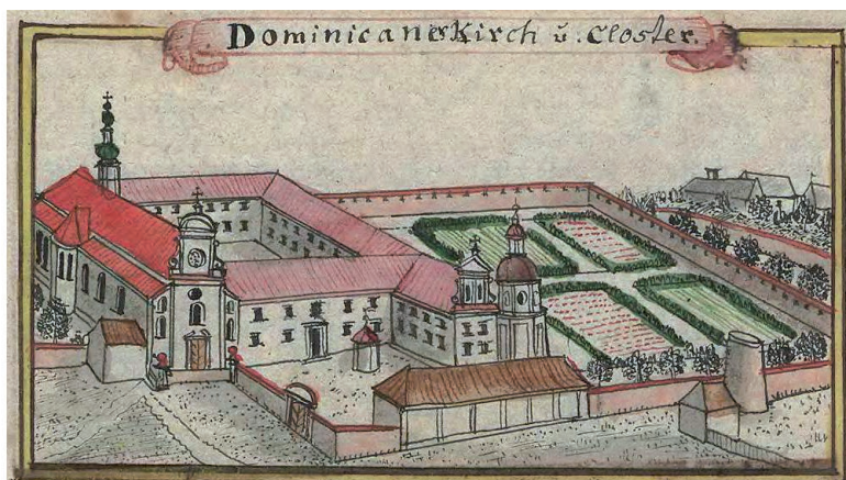
Kościół św. Wojciecha oraz klasztor dominikanów w Opolu. BUWr, F.B. Wernher, Silesia in Compendio , s. 189.