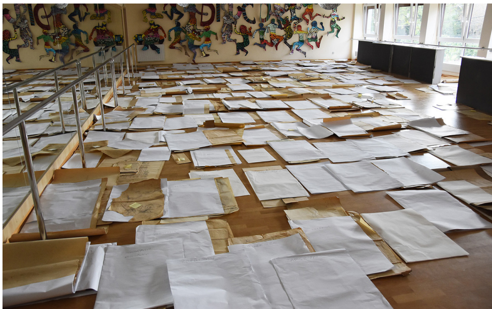
Il. 1. Skatalogowane zbiory przed zarchiwizowaniem, maj 2021 r.

Wszystko to sprawia, że Zbiory Dąbrowskich z Żołyni to kolekcja niezwykle ważna, bo dotyczy dziedzictwa sakralnego i świeckiego XIX i XX w. w kontekście transgranicznym, ale też praktyki warsztatów snycerskich. Opracowanie kolekcji i jej udostępnienie badaczom pozwoli na znaczące dopełnienie obrazu historii rodzimej sztuki oraz życia społeczno-artystycznego Galicji i Rzeczypospolitej.