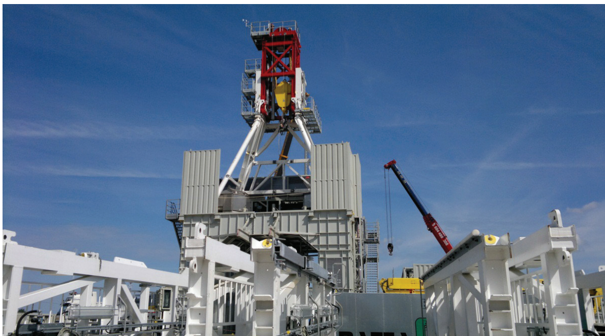
Rys. 1. Konstrukcja urządzenia wiertniczego

Oddziaływanie procesu wydobywczego gazu z łupków na środowisko było i jest przedmiotem licznych badań i analiz naukowych. Wynika z nich, że prawidłowo prowadzone wydobywanie gazu z łupków nie ma wpływu na jakość wody pitnej, zanieczyszczenie powietrza i gleby, czy procesy sejsmiczne. Naukowcy nie widzą też zagrożeń dla zdrowia ludzi i zwierząt (Konieczńska et al. 2011), a zastosowanie wszystkich wymaganych prawem procedur i środków ostrożności stanowi podstawę do zabezpieczenia środowiska naturalnego. Prawo europejskie gwarantuje ochronę środowiska przed skutkami przemysłu wydobywczego. Do najważniejszych instytucji, które sprawują kontrolę bezpieczeństwa środowiskowego przy poszukiwaniach i wydobywaniu gazu z łupków należą: Ministerstwo Środowiska, Generalna Dyrekcja Ochrony Środowiska, Krajowy Zarząd Gospodarki Wodnej, Główny Inspektorat Ochrony Środowiska, Wyższy Urząd Górniczy oraz władze samorządowe. Rozpoznawanie, poszukiwanie i wydobywanie gazu z łupków jest możliwe jedynie na podstawie koncesji wydawanej przez Ministerstwo Środowiska. Inwestor jest zobowiązany do uzyskania decyzji o środowiskowych uwarunkowaniach, która stanowi załącznik do