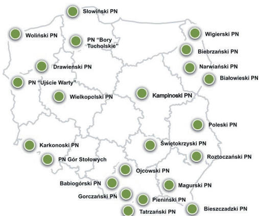
Ryc. 1. Rozmieszczenie parków narodowych w Polsce

Parki narodowe w Polsce znajdują się na różnych pasach rzeźby terenu: wyżynach, pojezierzach, na terenach górzystych, nizinnych i nadmorskich (Włodarczyk 2011, 12). Ich rozmieszczenie przedstawia ryc. 1.