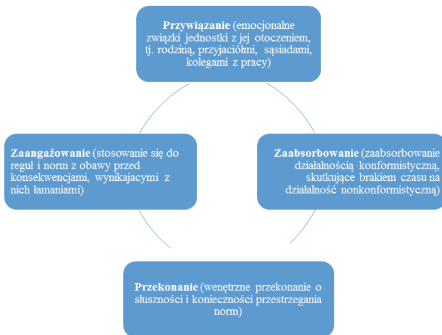
Schemat 4. Zmienne socjologiczne w teorii T. Hirschiego

Zgodnie z założeniami teorii kontroli społecznej Trávisa Hirschiego „jednostka może dokonywać czynów przestępczych, ponieważ jej więzi z porządkiem konformistycznym zostały w jakiś sposób zerwane” 53 . Hirschi wskazuje, że istnieje jeden wspólny wszystkim członkom społeczeństwa system norm i wartości, niezależnie od tego, czy dane osoby naruszają normy społeczne, czy nie. Autor sformułował cztery zmienne socjologiczne, które wzajemnie się uzupełniają, są ze sobą powiązane, a jednocześnie mają wpływ na zachowanie człowieka (zarówno zachowanie pozytywne, jak i negatywne) (schemat 4).