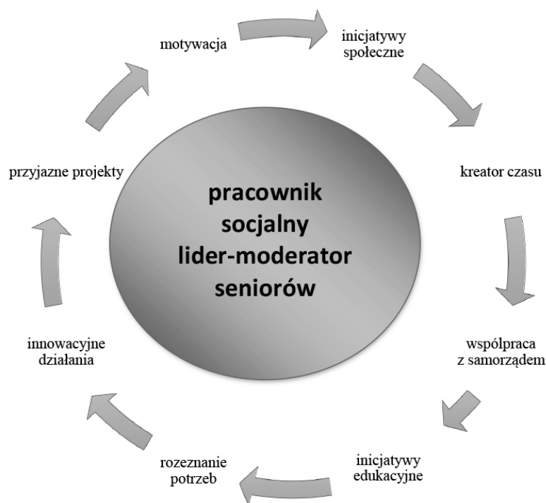
Rysunek 1. Pracownik socjalny jako lider seniorów w społeczności lokalnej

Pracownik socjalny jako animator społeczny pełniłby rolę związaną z procesem zarządzania dostępnymi usługami w środowisku lokalnym. Jest rzecznikiem, mediatorem i koordynatorem. Występując z ramienia samorządu lokalnego dobrze zna potrzeby seniorów, ich zasoby zewnętrzne. Jako zaś lider-moderator może aktywnie prowadzić wiele przedsięwzięć z seniorami i dla seniorów. Jego działania powinny być ukierunkowane wieloaspektowo: rozeznania potrzeb seniorów, podejmowanie inicjatyw społecznych, podejmowanie inicjatyw edukacyjnych, kreator wolnego czasu, współpraca z podmiotami samorządowymi, podejmowanie innowacyjnych działań, tworzenie przyjaznych projektów, motywowanie seniorów do wspólnych działań kulturowych.