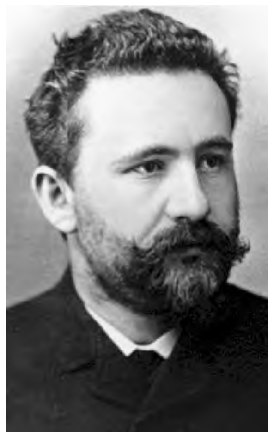
Emil Kraepelin (1856-1926)