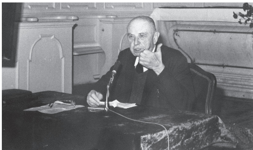
Zdjęcia z wykładu o J.M. Bocheńskiego wygłoszonego na ATK 5.11.1987 r.