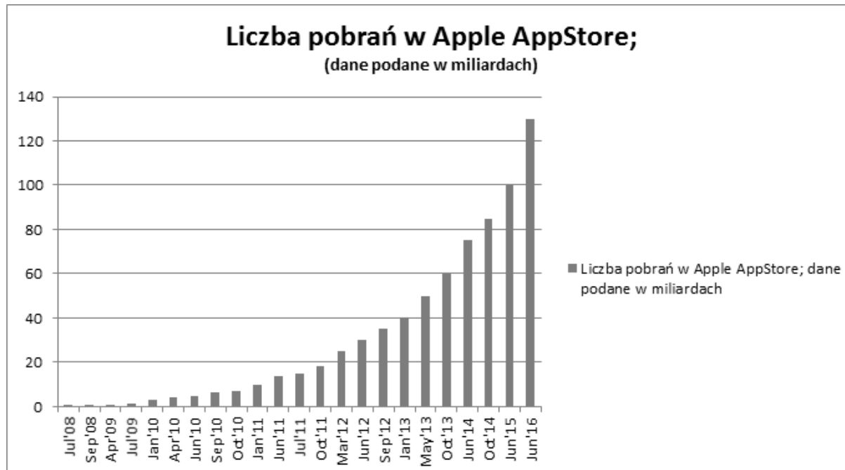
Wykres 2. Liczba pobrań w Apple AppStore

Poniższe dane przedstawiają skumulowaną liczbę pobrań aplikacji w App Store od lipca 2008 do czerwca 2016 r.