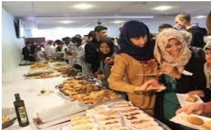
Rysunek 2. Ubiór muzułmanek w Polsce