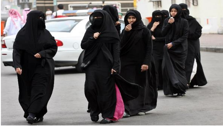
Rysunek 1. Ubiór kobiety w Arabii Saudyjskiej