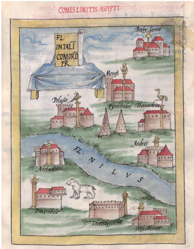
Fig. 4. Insignia comes limitis Aegypti – Not. Dig. Or. 28. (Monacensis Latinus 10291, Palatinus 291. Bayerische Staatsbibliothek München/ Bildarchiv, ms. Clm. 10291: codex 1), Folio: fol. 113r