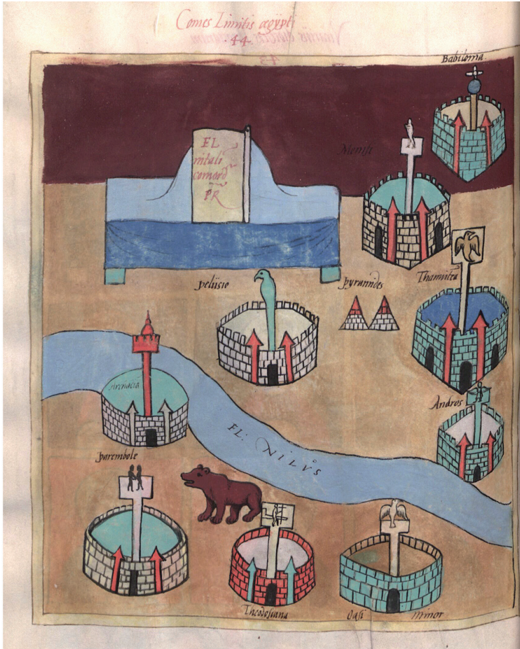
Fig. 2. Insignia comes limitis Aegypti – Not. Dig. Or. 28. (Monacensis Latinus 10291, Palatinus 291. Bayerische Staatsbibliothek München/ Bildarchiv, ms. Clm. 10291: codex 2), Folio: 196v